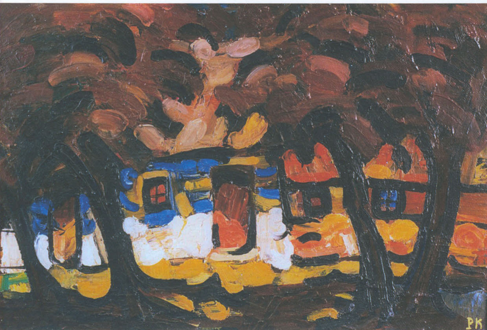
CASSETTA DELL'INFANZIA I caldi colori del ricordo