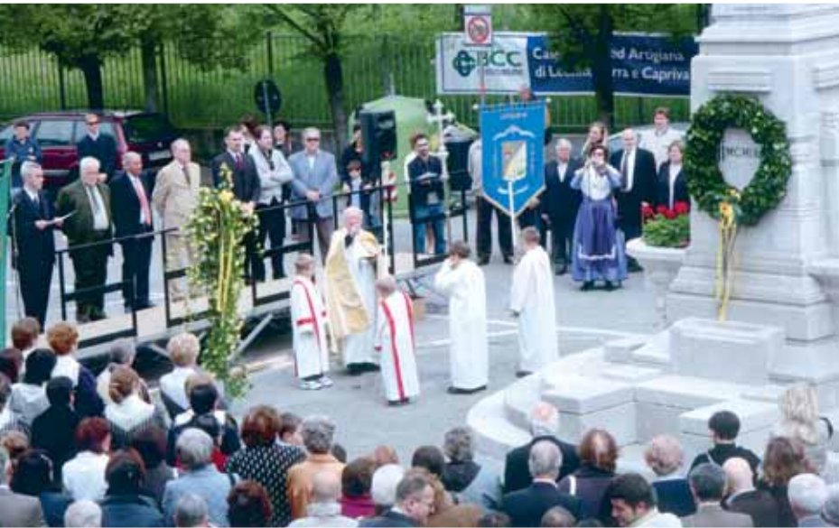
Festeggiamenti per i 100 anni della fontana 2009