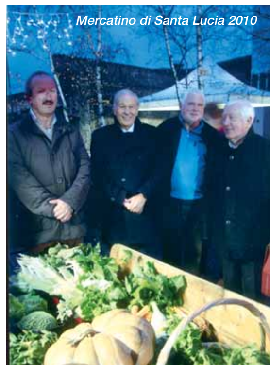
Mercatino di Santa Lucia 2010