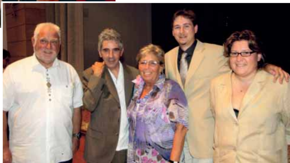
Inaugurazione mostra dedicata al maestro E. Komel 2010

Le fotografie presenti in queste 3 pagine dedicate al presidente Martellani sono state gentilmente concesse dal fotografo sanroccaro Renzo Crobe