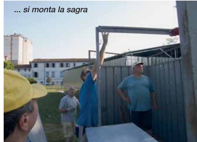
... si monta la sagra