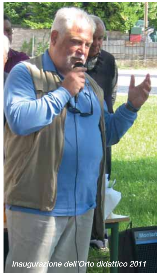
Inaugurazione dell'Orto didattico 2011

e importanti iniziative che da quasi quarant'anni danno forma e sostanza all'antico Borgo di San Rocco. Certamente non si può non mettere in evidenza la "grande impresa agostana" cioè la plurisecolare Sagra, evento immancabile dell'estate Goriziana, che è stato arricchito da nuove iniziative, come gli incontri sotto l'albero che sono diventati un momento fondamentale e seguitissimo, anche grazie alle competenze eno-gastronomiche dei relatori, moderatori e degli ospiti. Durante il periodo di sagra è stato