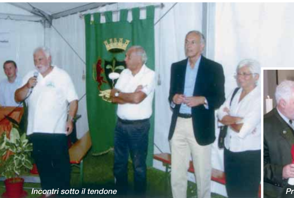
Incontri sotto il tendone