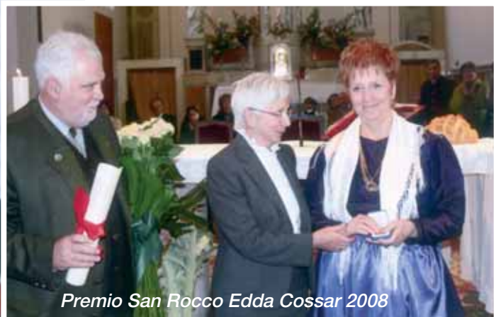
Premio San Rocco Edda Cossar 2008