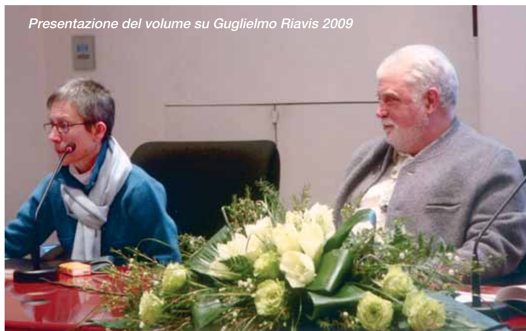
Presentazione del volume su Guglielmo Riavis 2009