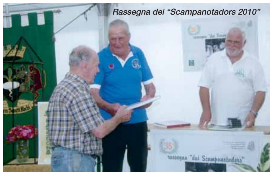
Rassegna dei "Scampanotadors 2010"