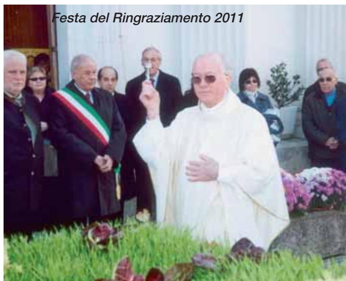
Festa del Ringraziamento 2011