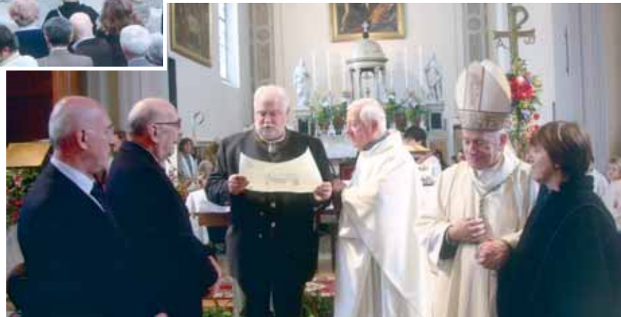
Premio San Rocco Guido Bisiani 2010