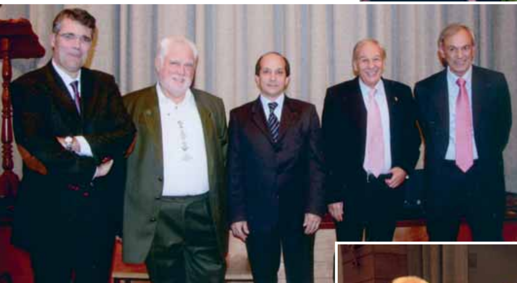
Premio San Rocco Mauro Fontanini 2009