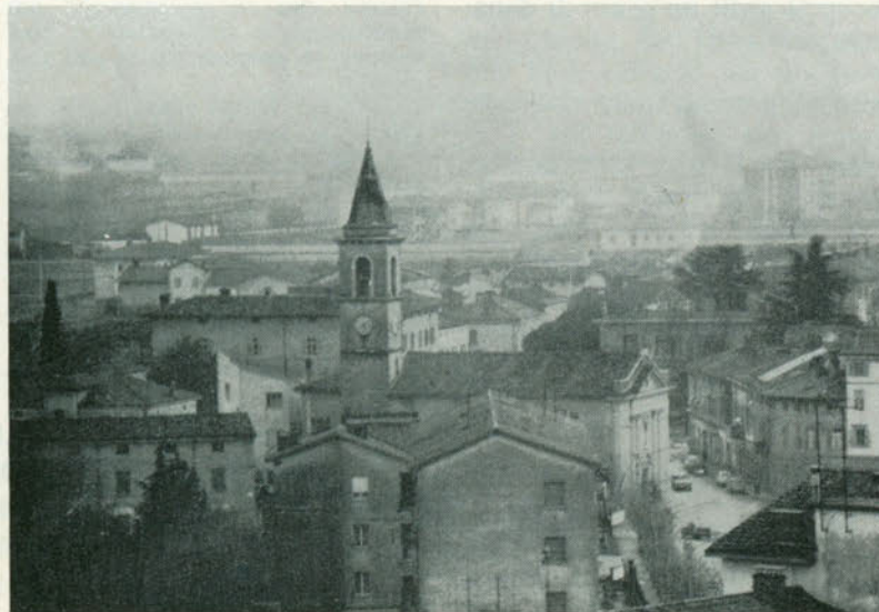
Panoramica del Borgo