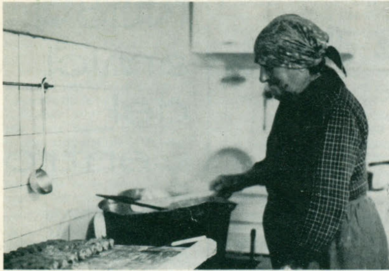
Si preparin li fulis