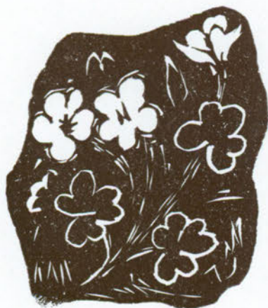
L'Acetosella, simbolo della povertà