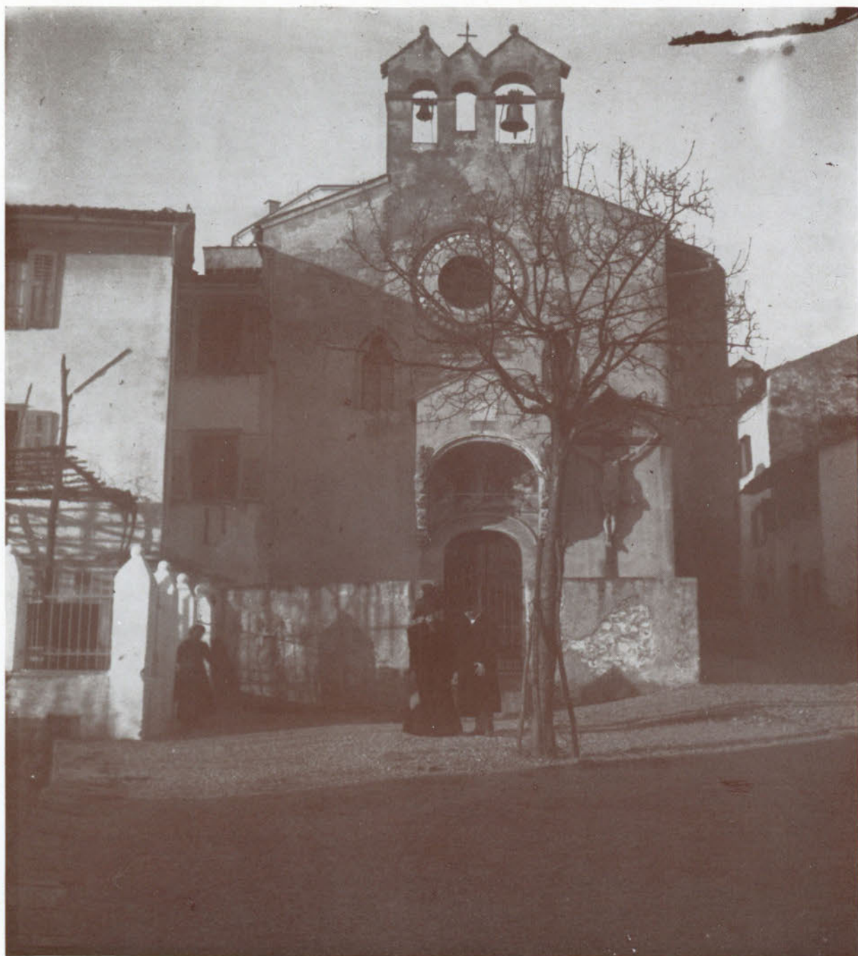
Sul colle del Castello da oltre sei secoli la Chiesa di Santo Spirito guarda alla Città.