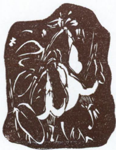
La Fucsia, simbolo del desiderio