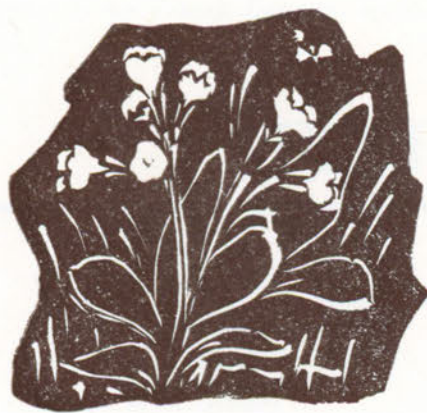
La Primula, simbolo della giovinezza