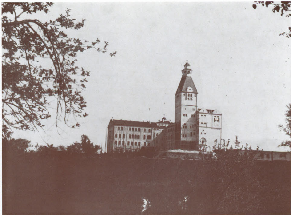
Il Seminario « Nuovo » dalla Via Dreossi, ora Via Alviano.