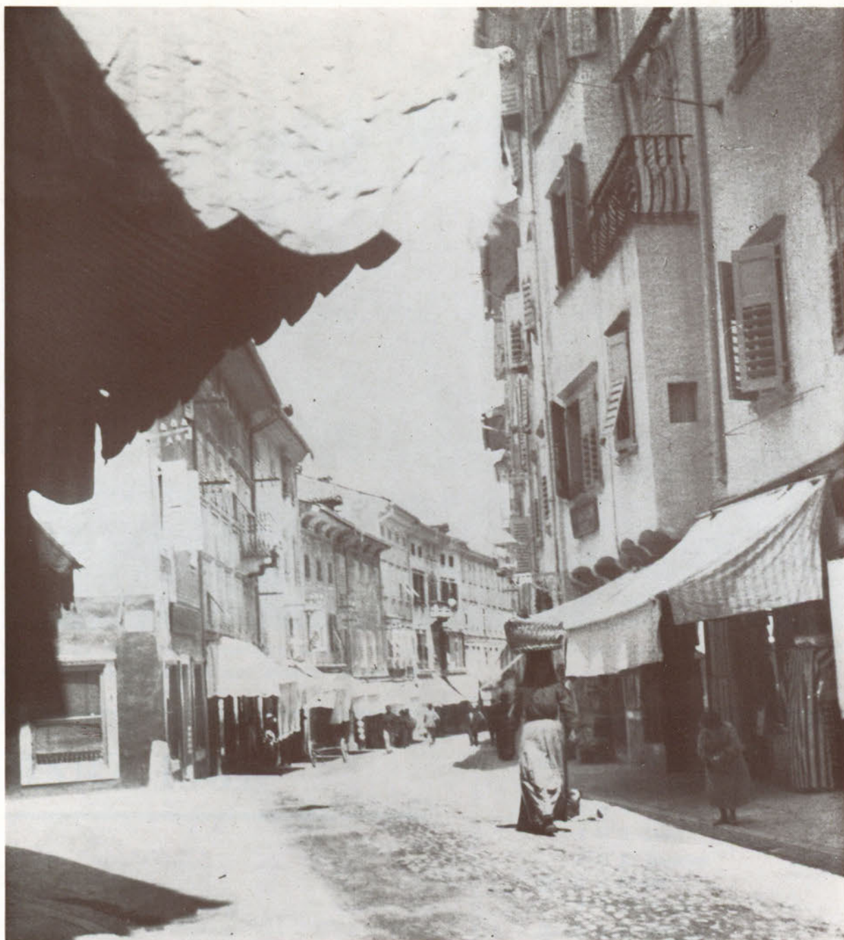
Via Rastello verso Piazza Grande, quando era un'invidiabile isola pedonale.