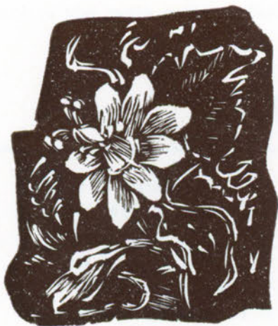
Il Fior della passione, simbolo della sofferenza