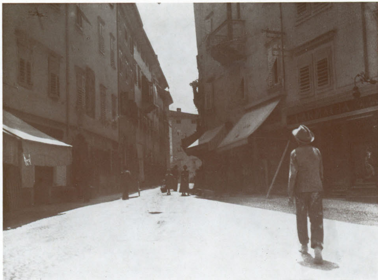
Via Rastello verso Piazza Duomo, davanti alla farmacia « Ai due Mori ».