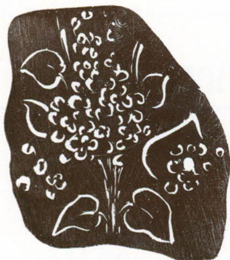
I Lilla, simbolo della ritrosia e del sospetto