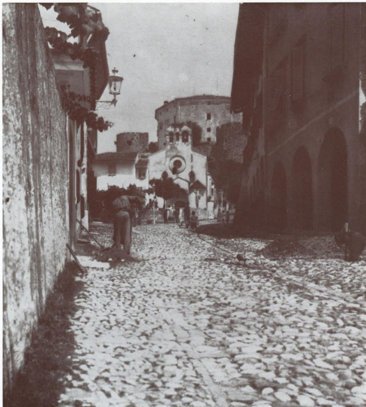
Sull'acciottolato che porta a Santo Spirito, in un mattino d'estate.