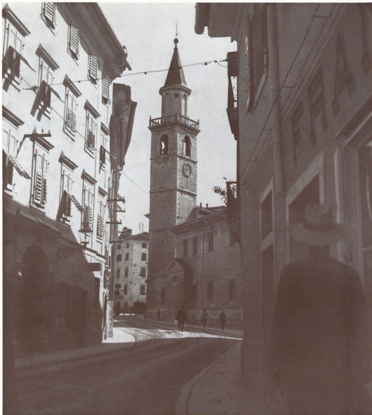
Il tempo si è fermato all'ombra del campanile nella vecchia Via Duomo.