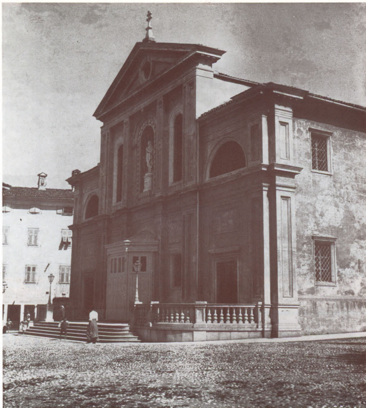
Chiesa del Duomo prima del bombardamento e successiva ricostruzione.