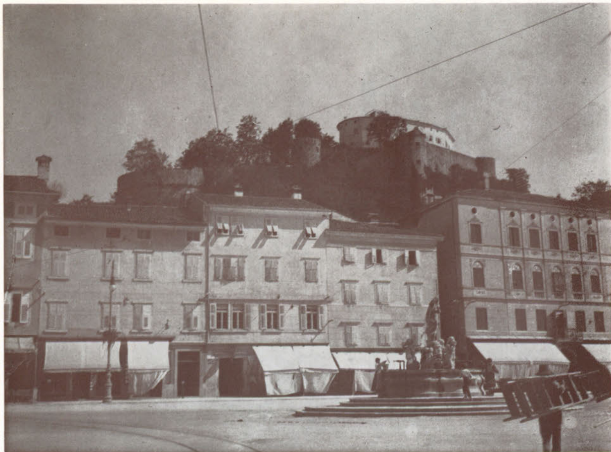
Piazza Grande, un Castello inedito per noi, le rotaie del tram e tanto sole.