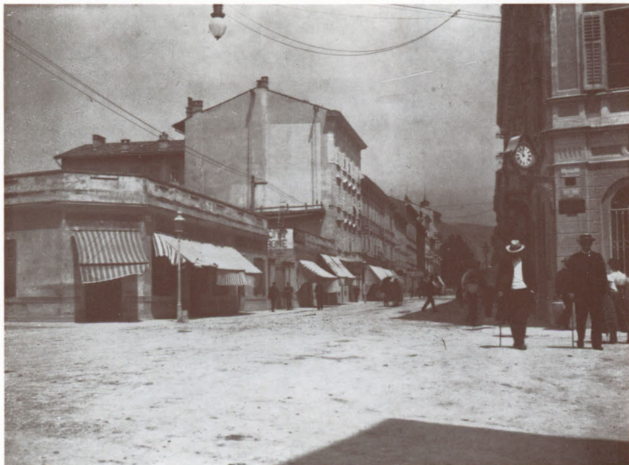
Corso Giuseppe Verdi dove attualmente sorge la sede centrale della Cassa di Risparmio.