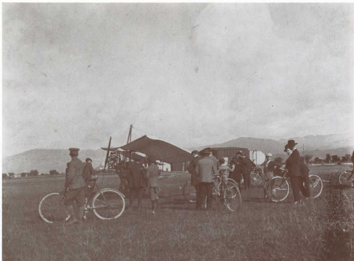
Primi esperimenti di volo nella « Campagna grande » ora l'aeroporto di Via Trieste.