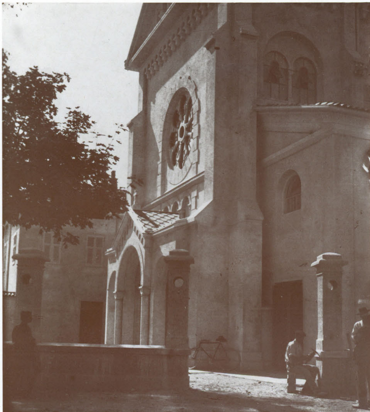
Chiesa dei padri Cappuccini nel 1911.