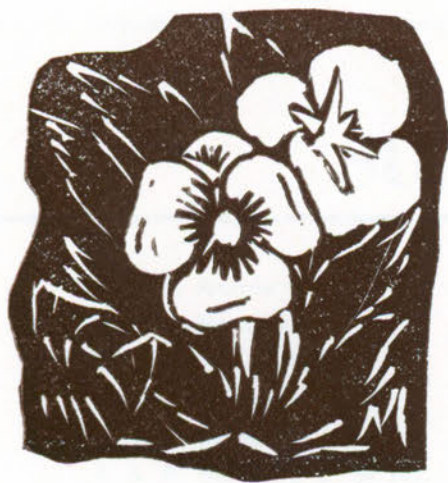
La Viola del pensiero, simbolo della ricordanza reciproca