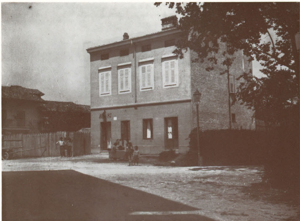
Via Lunga dalla Via Toscolano, quando si attingeva l'acqua alla fontana e i bambini e i grandi si mettevano sull'attenti per essere fotografati.