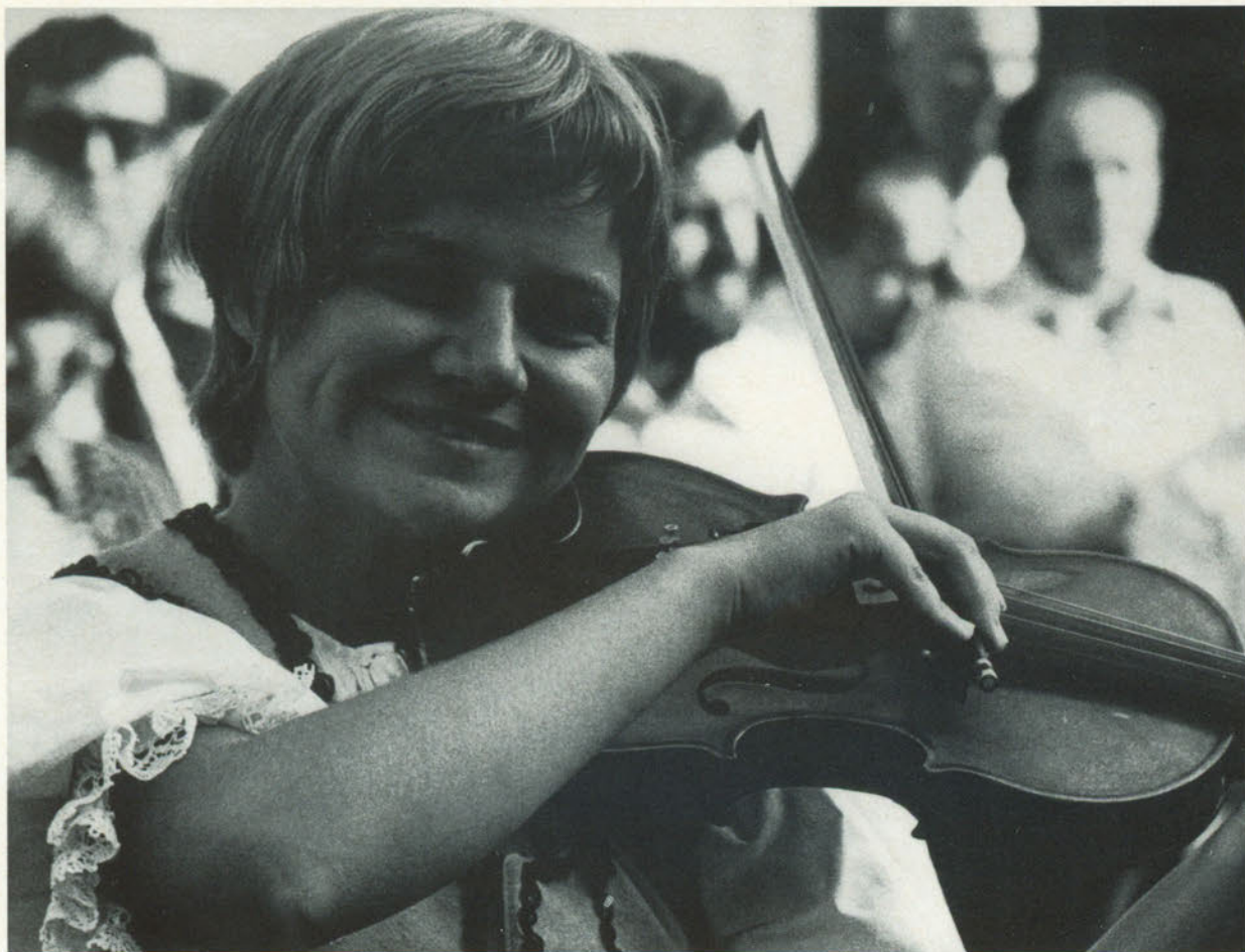
Fossette maliziose accompagnano il magico archetto!