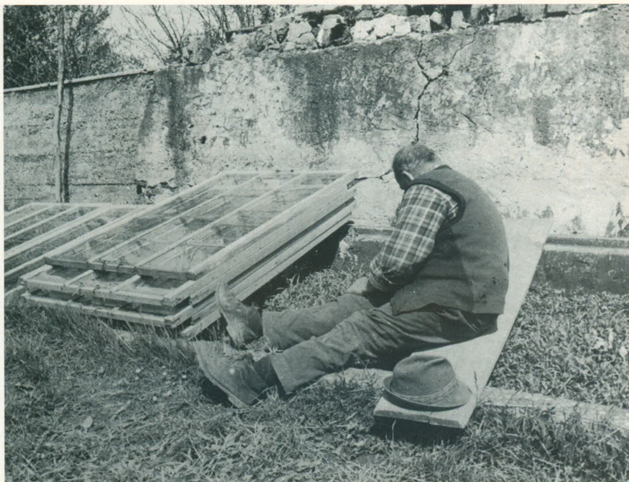
L'amorevole, faticosa pazienza del « sborzà ».