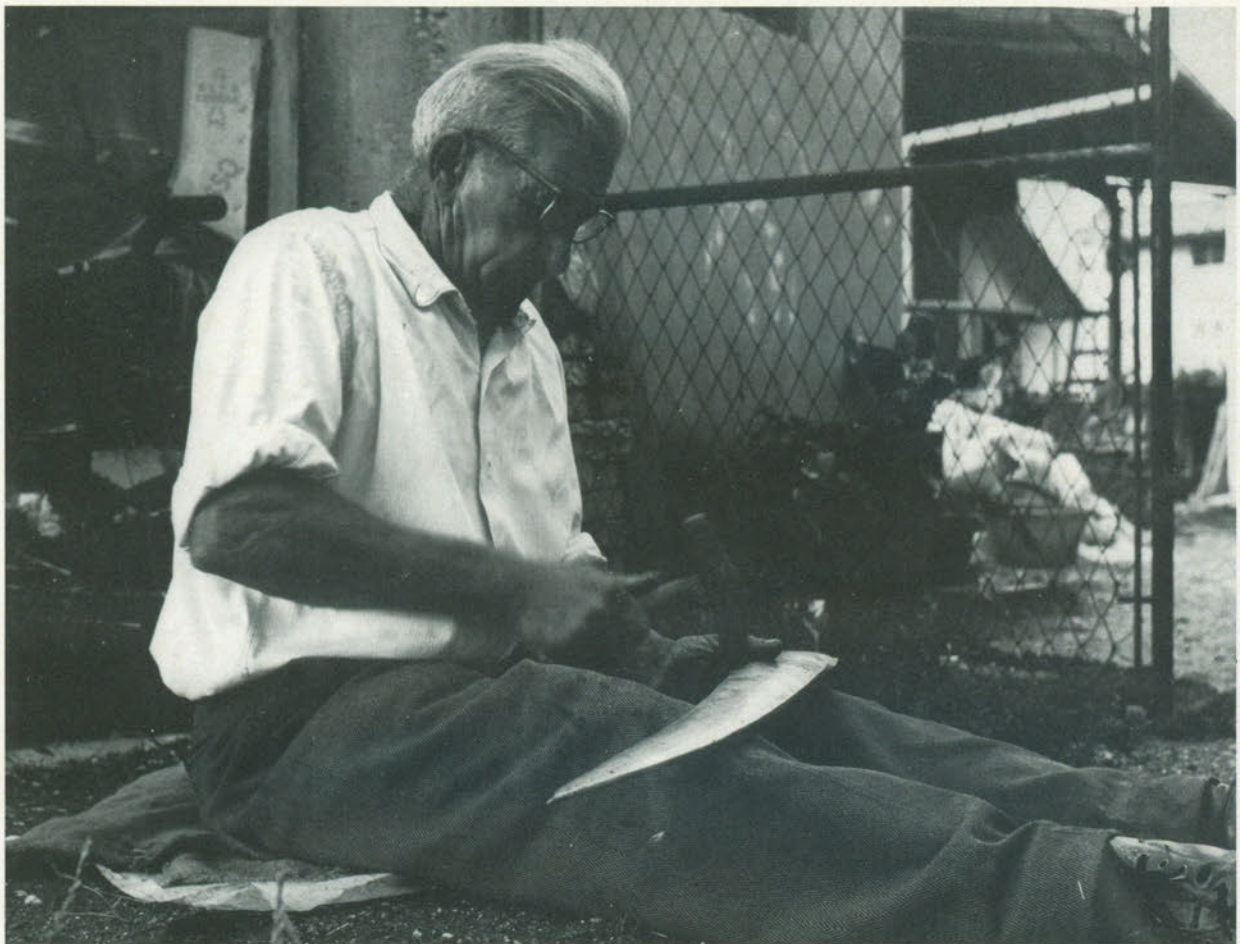
Azione e contemplazione.