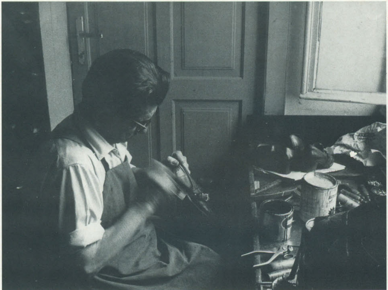
Il calzolaio: umile e prezioso.