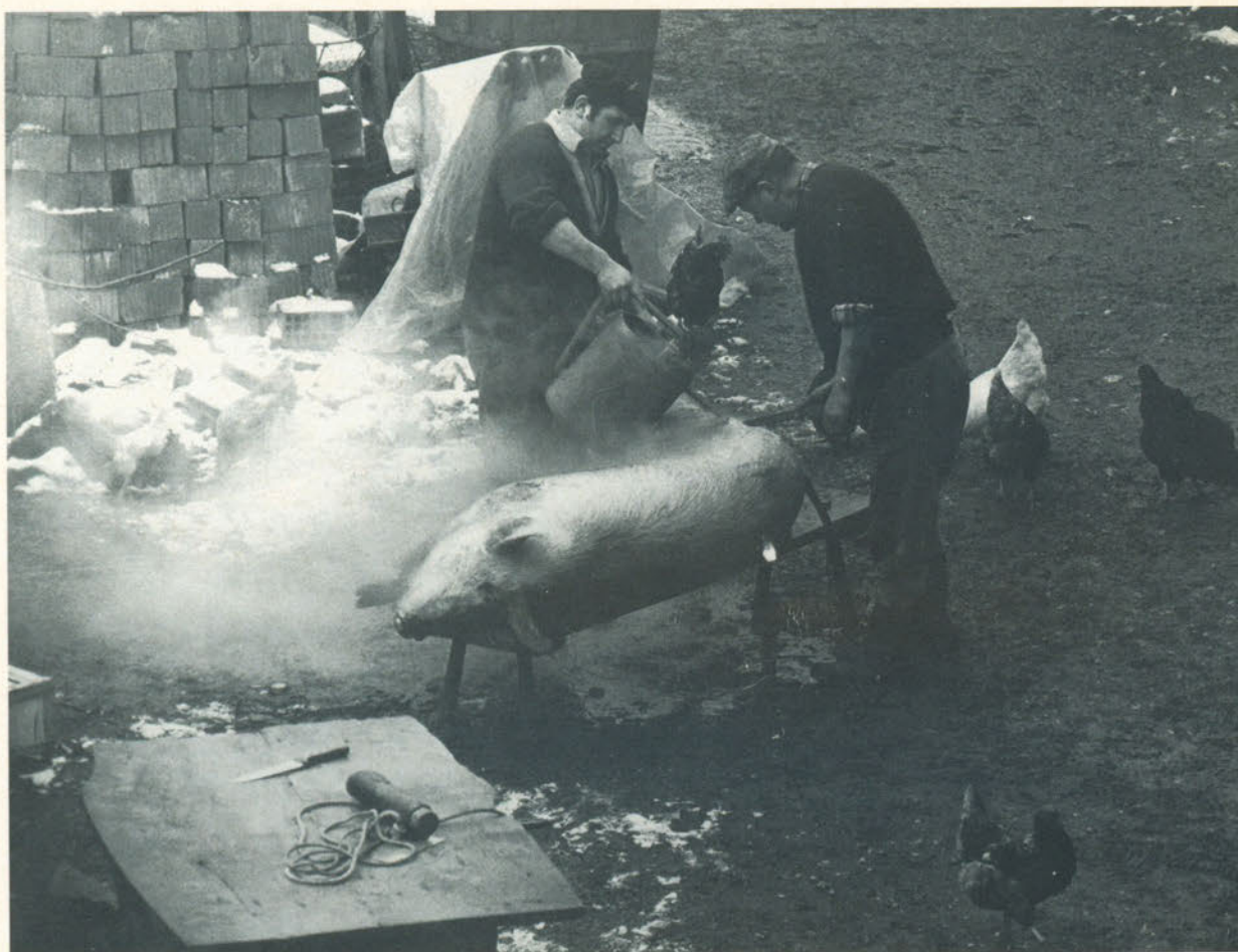
FESTA AL MAIALE... suo malgrado.