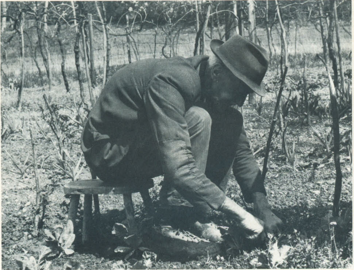
Serenità è la speranza di un buon raccolto.