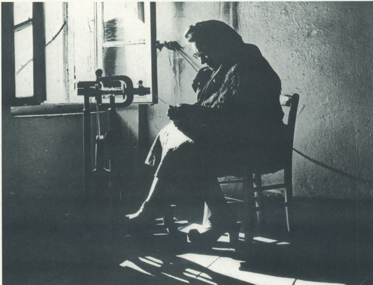
Luci e ombre sull'arcolajo.