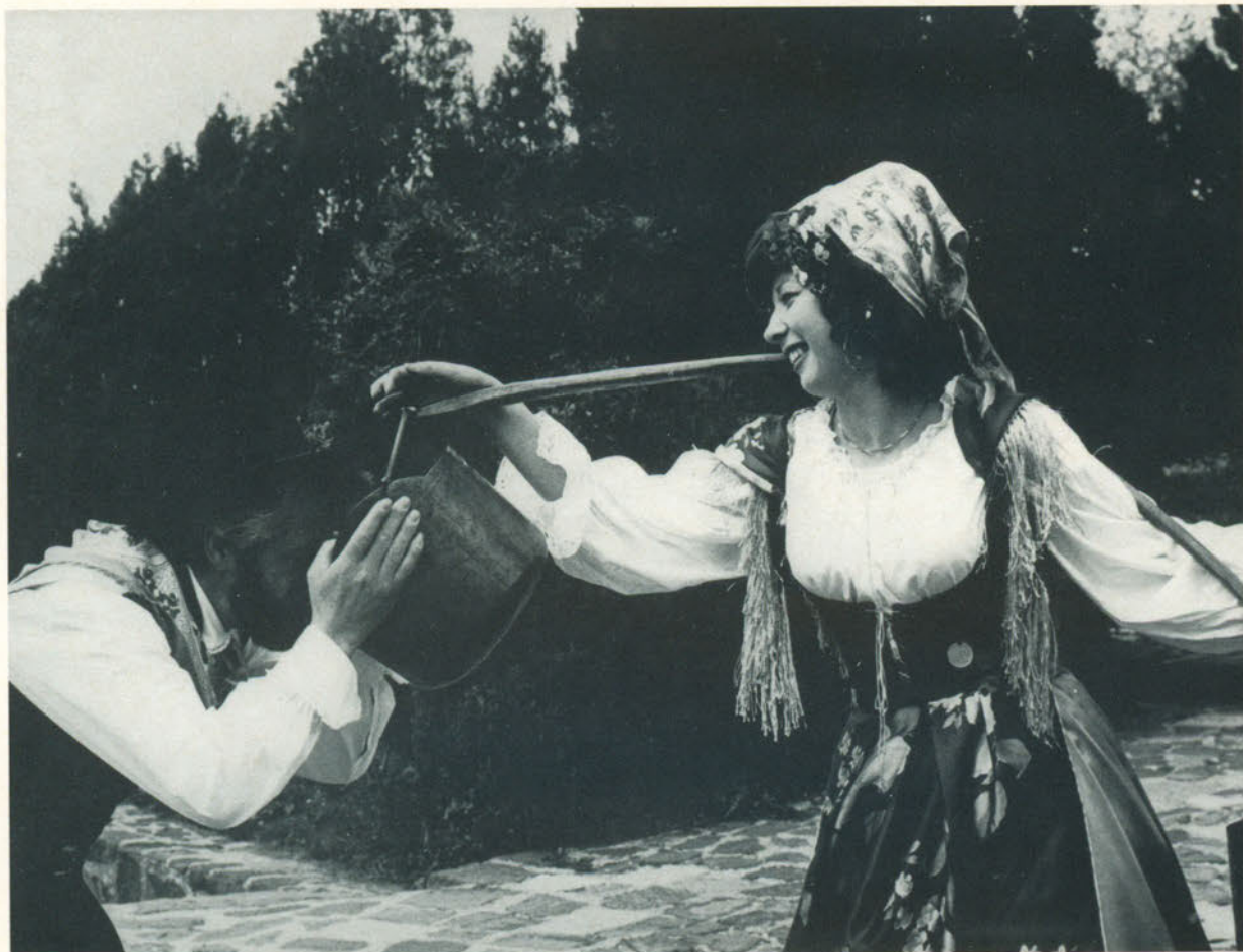
La primavera in un sorriso.