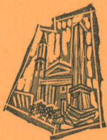
Centro conservazione e valorizzazione tradizioni popolari BORGO SAN ROCCO