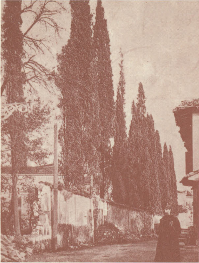
I vecchi cipressi di Via Macello (ora Via Fatti) costituivano quasi un sinistro presagio del terribile dramma che stava per abbattersi sul borgo.