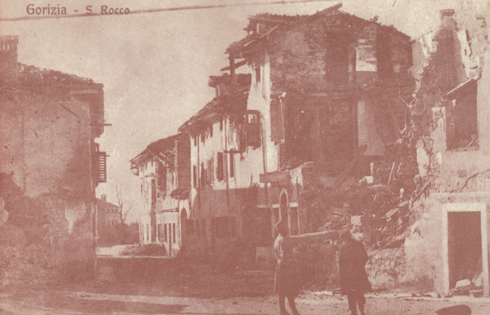
Così si presentava la Via della Canonica, ora Via Veniero. Questa desolante documentazione non ha bisogno di commenti.