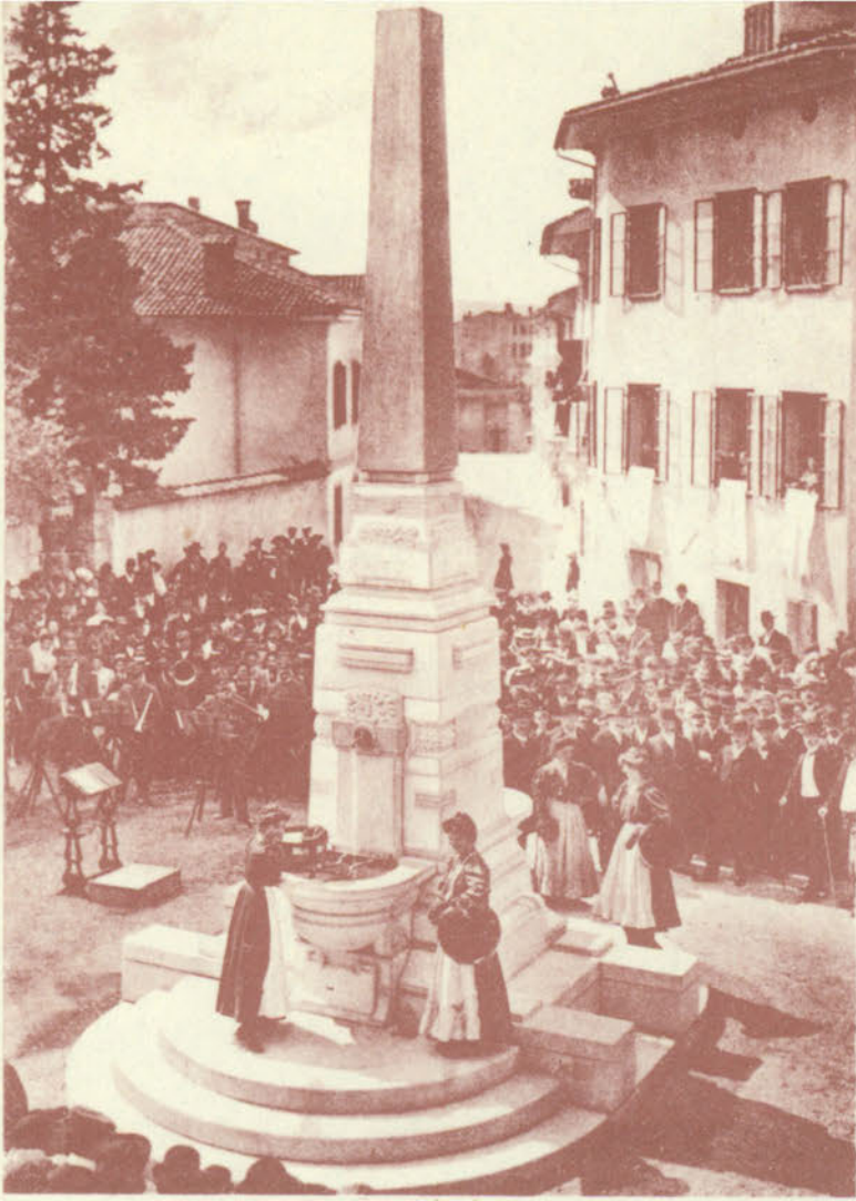
Il 25 aprile del 1909 fu inaugurata, con una festosa cerimonia, la fontana in Piazza San Rocco. L'acqua che vi sgorgava era simbolo di fecondità agricola ed auspicio di benessere per gli operosi abitanti del luogo.