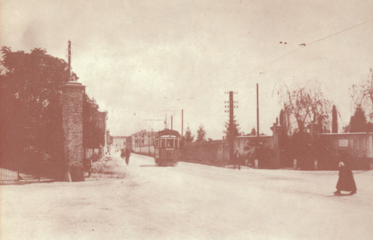
Ma il terribile uragano di morte finalmente si placò. I sanroccari superstiti cominciavano a ricostruire i loro focolari. Qui sopra il cimitero che aveva preso la denominazione di «Cimitero degli Eroi». Al centro il tram che partendo dal Caffè Garibaldi raggiungeva il paese di San Pietro ed a sinistra l'ingresso dell'attuale Fondazione Lenassi.