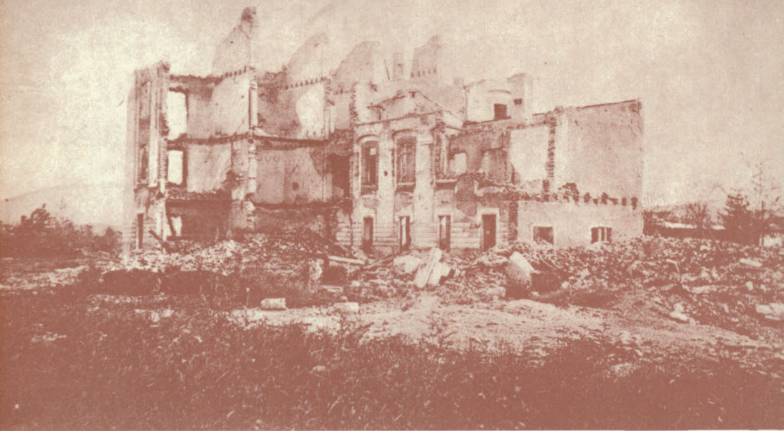
Il complesso del manicomio provinciale, una delle più progredite, per l'epoca, istituzioni d'Europa nel campo specifico, fu completamente raso al suolo.