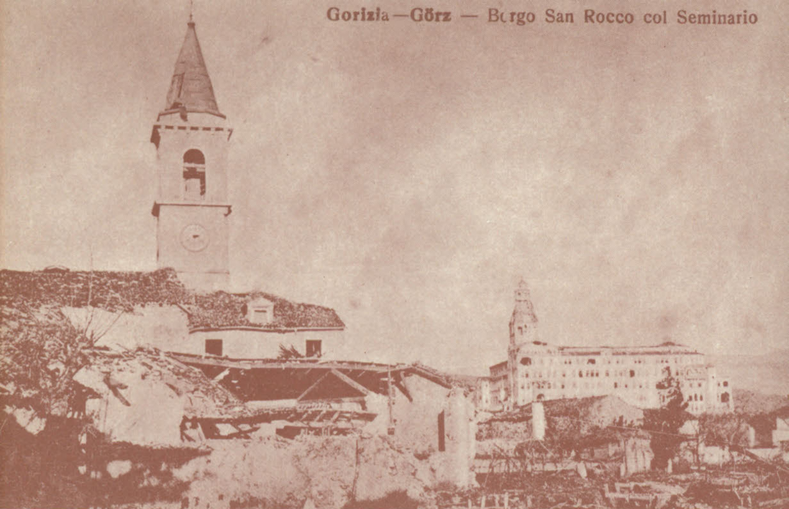
Scoppia la prima guerra mondiale. L'insensata furia degli uomini non rispetta né case né chiese. Distrugge i raccolti ed i sudati risparmi delle famiglie. La gente fugge chiedendosi: «Ci sarà un ritorno?»