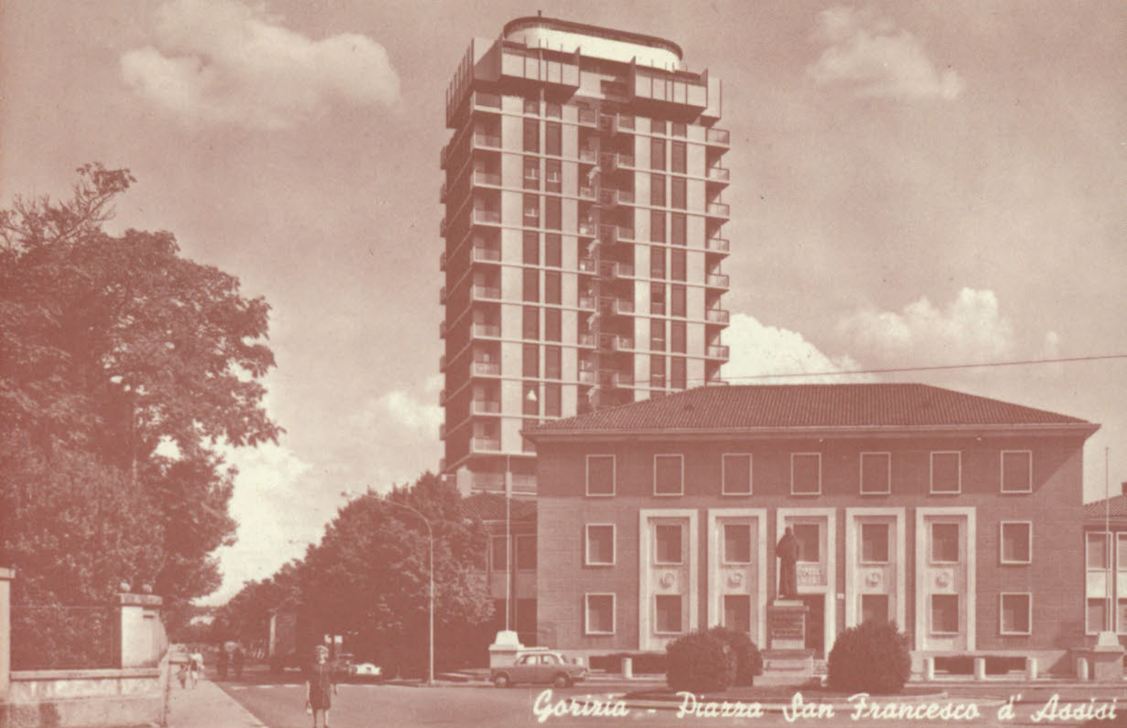
Gorizia - Piazza San Francesco d'Assisi

Lo stesso posto ripreso ai giorni nostri. L'imponente edificio è quasi il simbolo della volontà di tutti di proiettarsi verso un futuro fecondo e sereno.