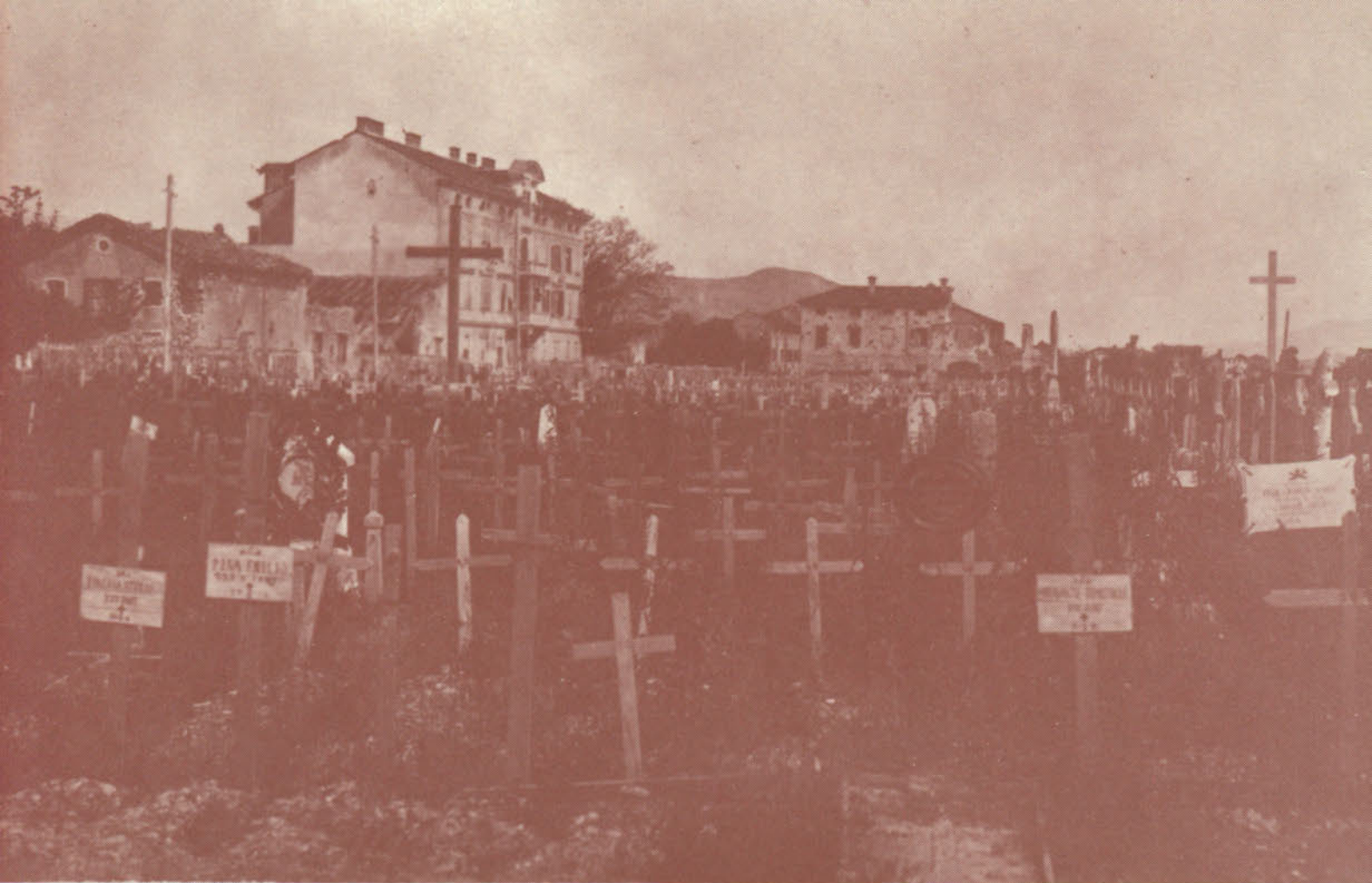
I militari caduti dell'esercito italiano ed austro-ungarico venivano man mano sepolti, uno a fianco all'altro, nell'area tra Via San Pietro (ora Via Vittorio Veneto) e le attuali Via del Fatti e Via Della Bona.