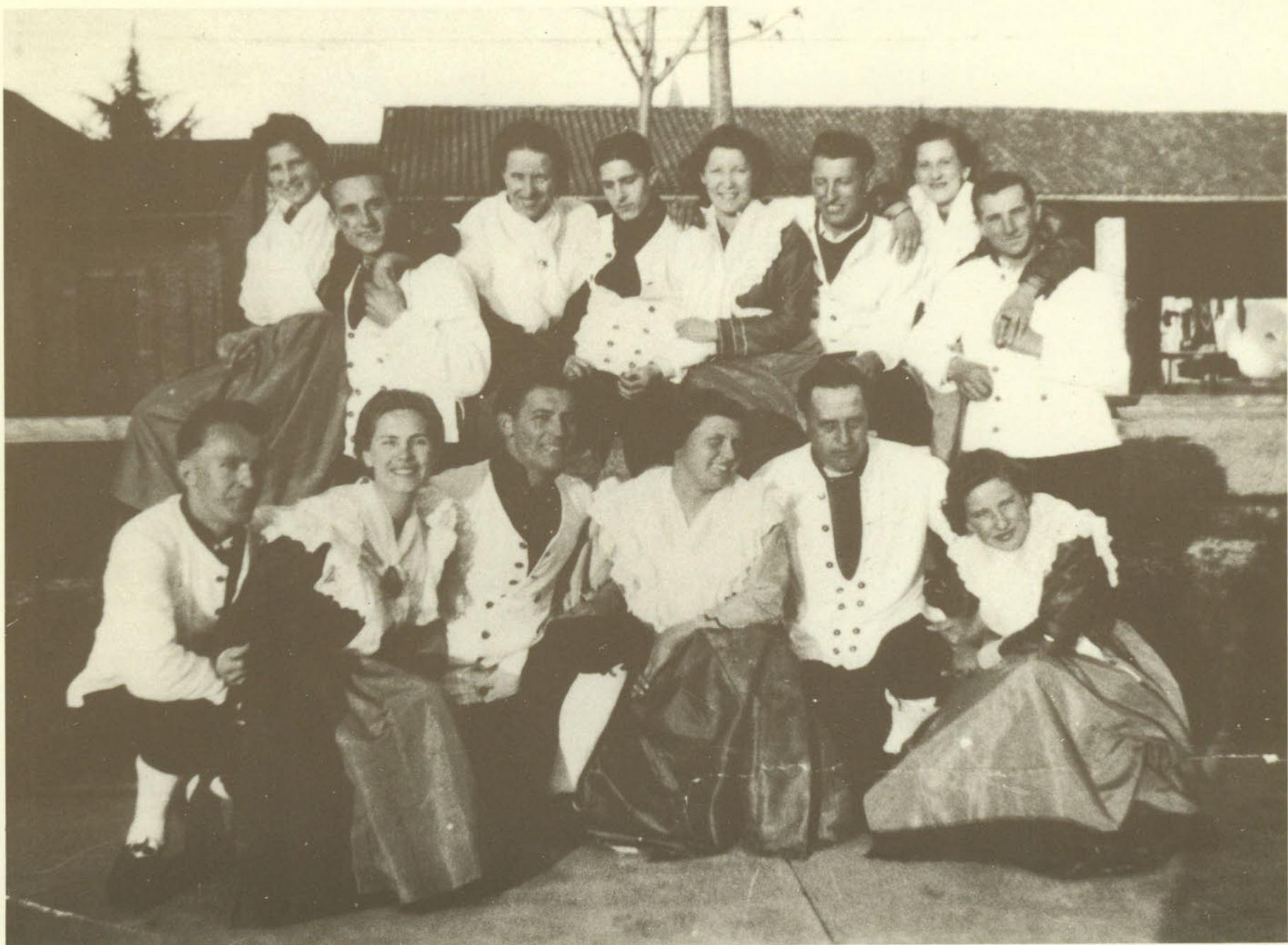
1938: IL GRUPPO ALLA FESTA DEL "MAI" (1° MAGGIO) A LUCINICO