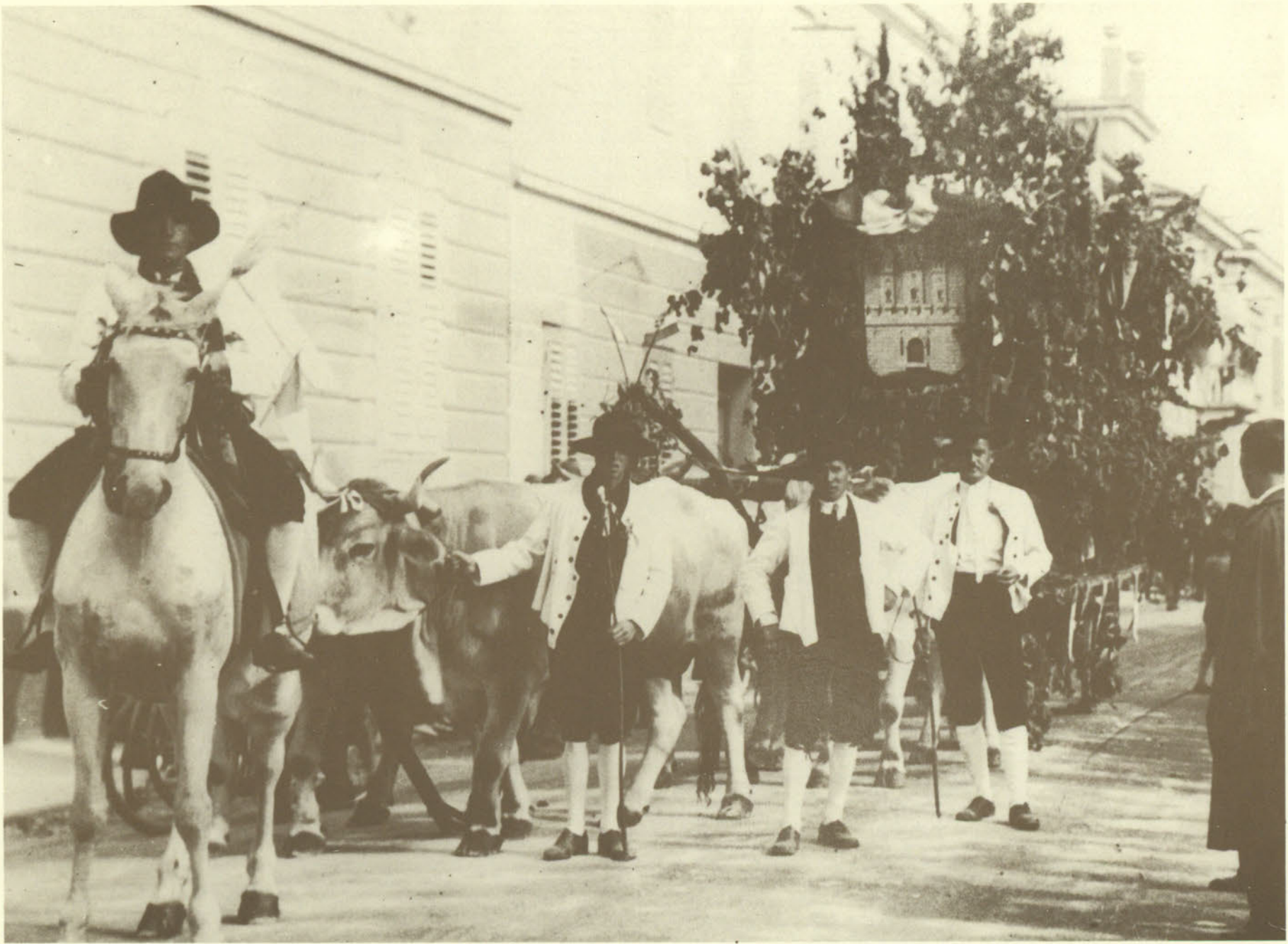
1931: IL CARRO DEL DOPOLAVORO "PRINCIPE DI PIEMONTE" ALLA FESTA DELL' UVA