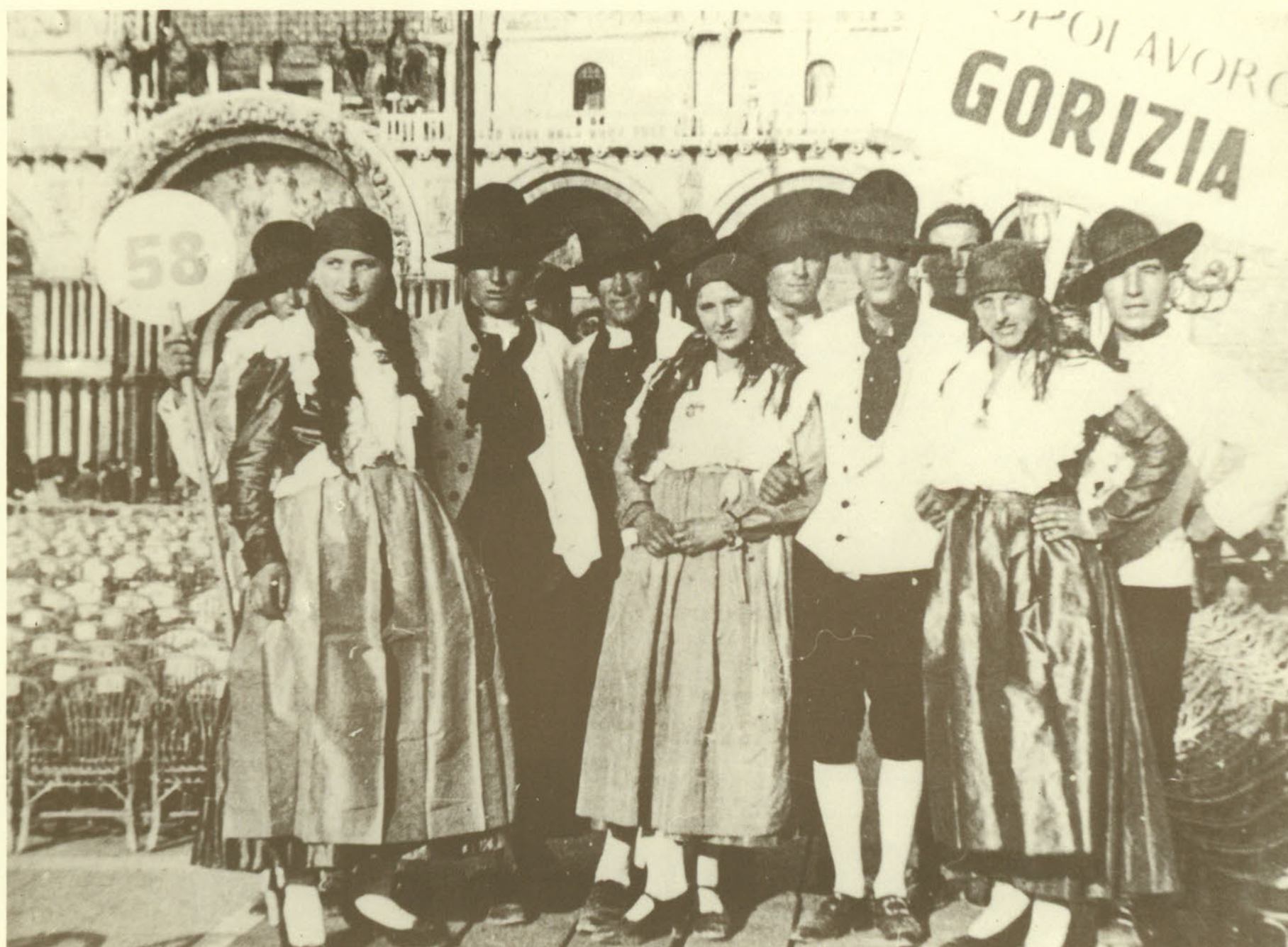
1928: VENEZIA "CONCORSO DI COSTUMI ITALIANI"