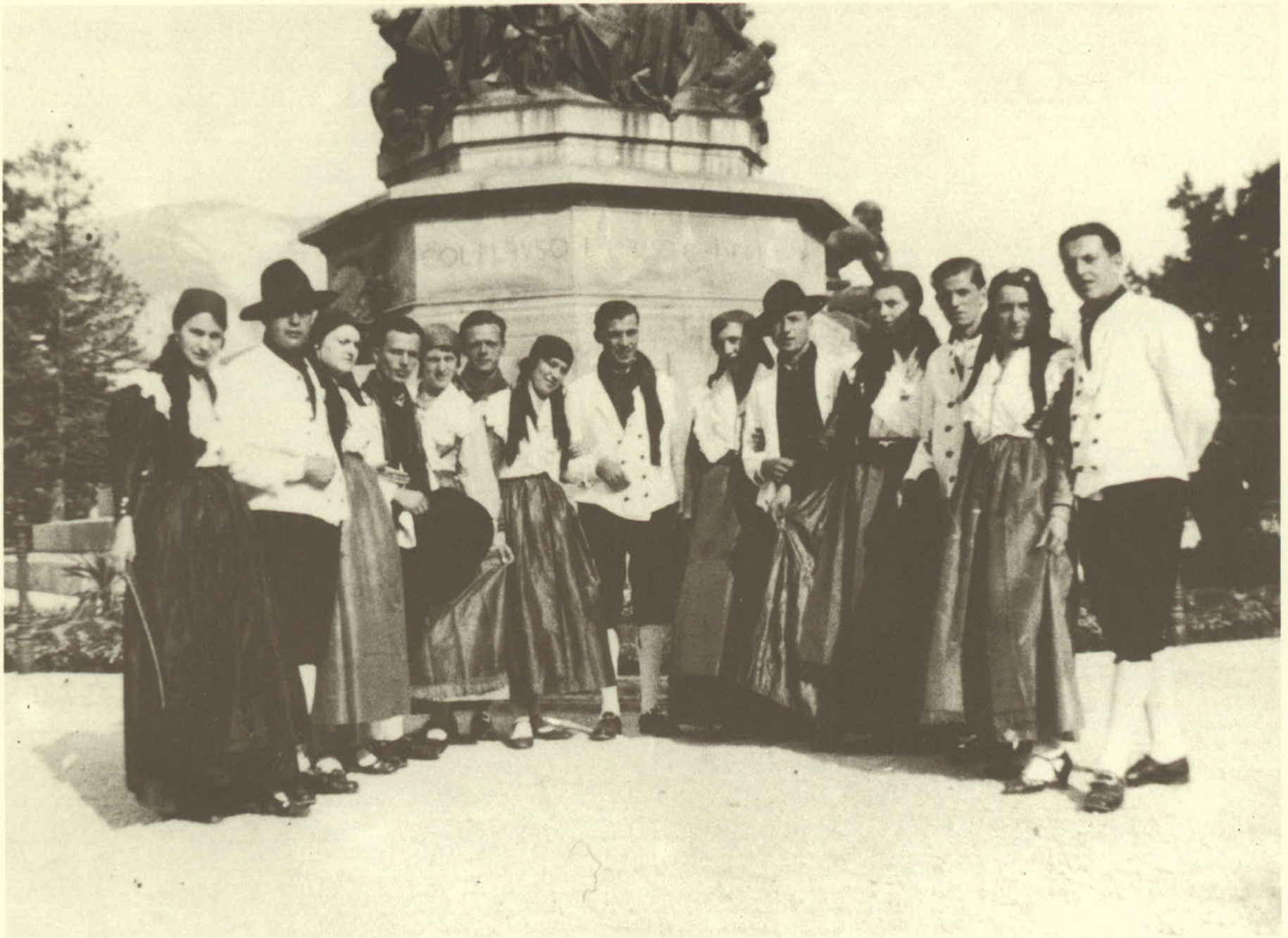
1934: CONCORSO FOLCLORISTICO DI TRENTO