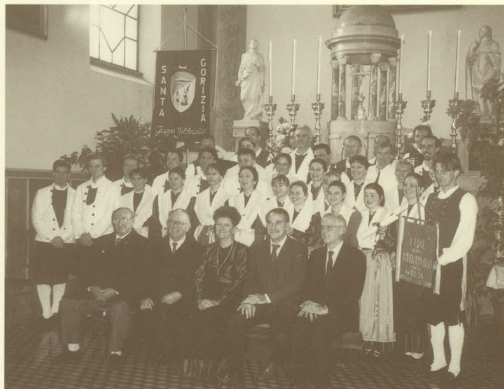
Il 16 novembre 1997, durante la Festa del Ringraziamento, il Centro Tradizioni ha conferito al Gruppo il Premio San Rocco per il 1997