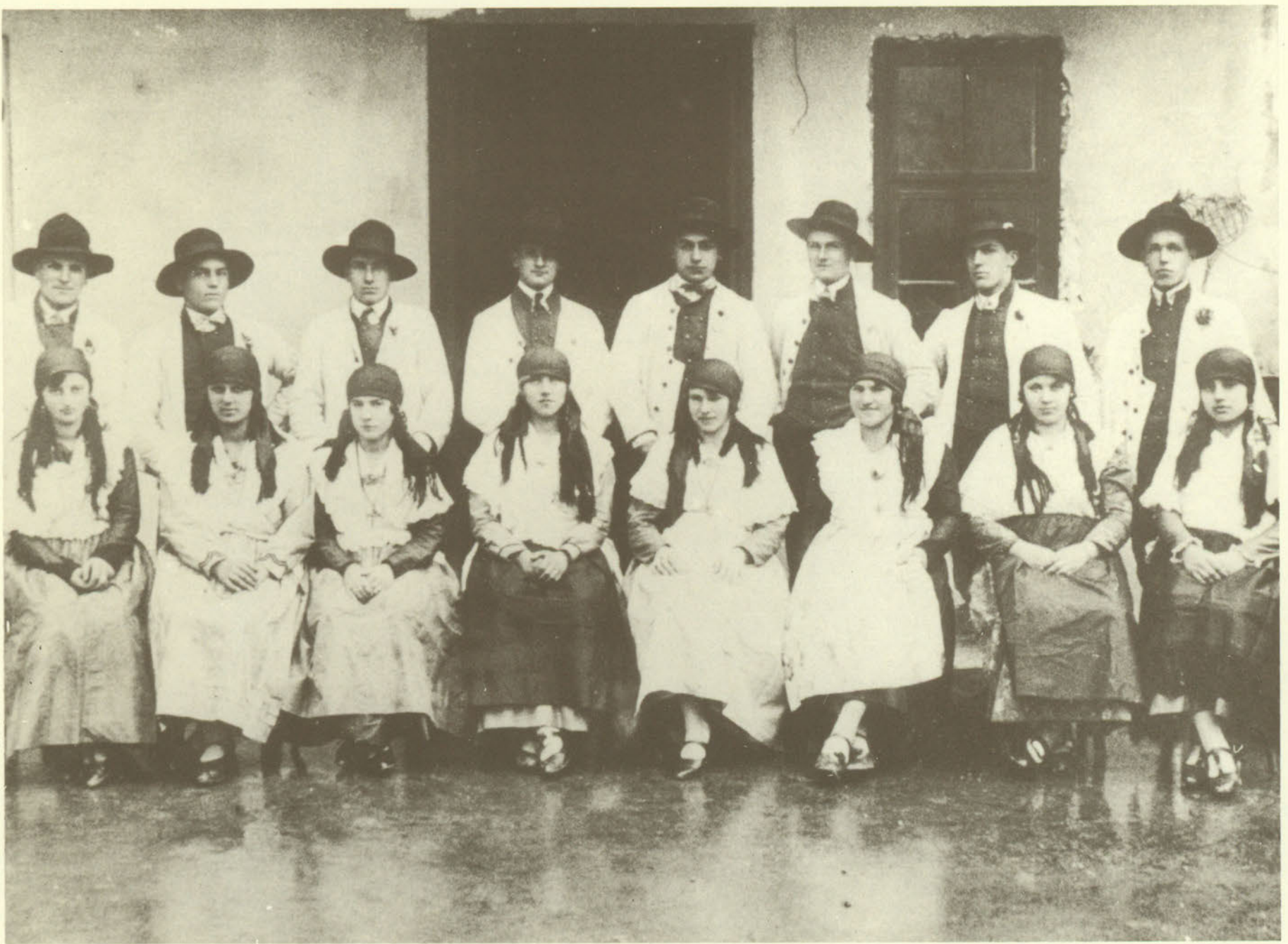
ANNI '20: OTTO COPPIE IN COSTUME