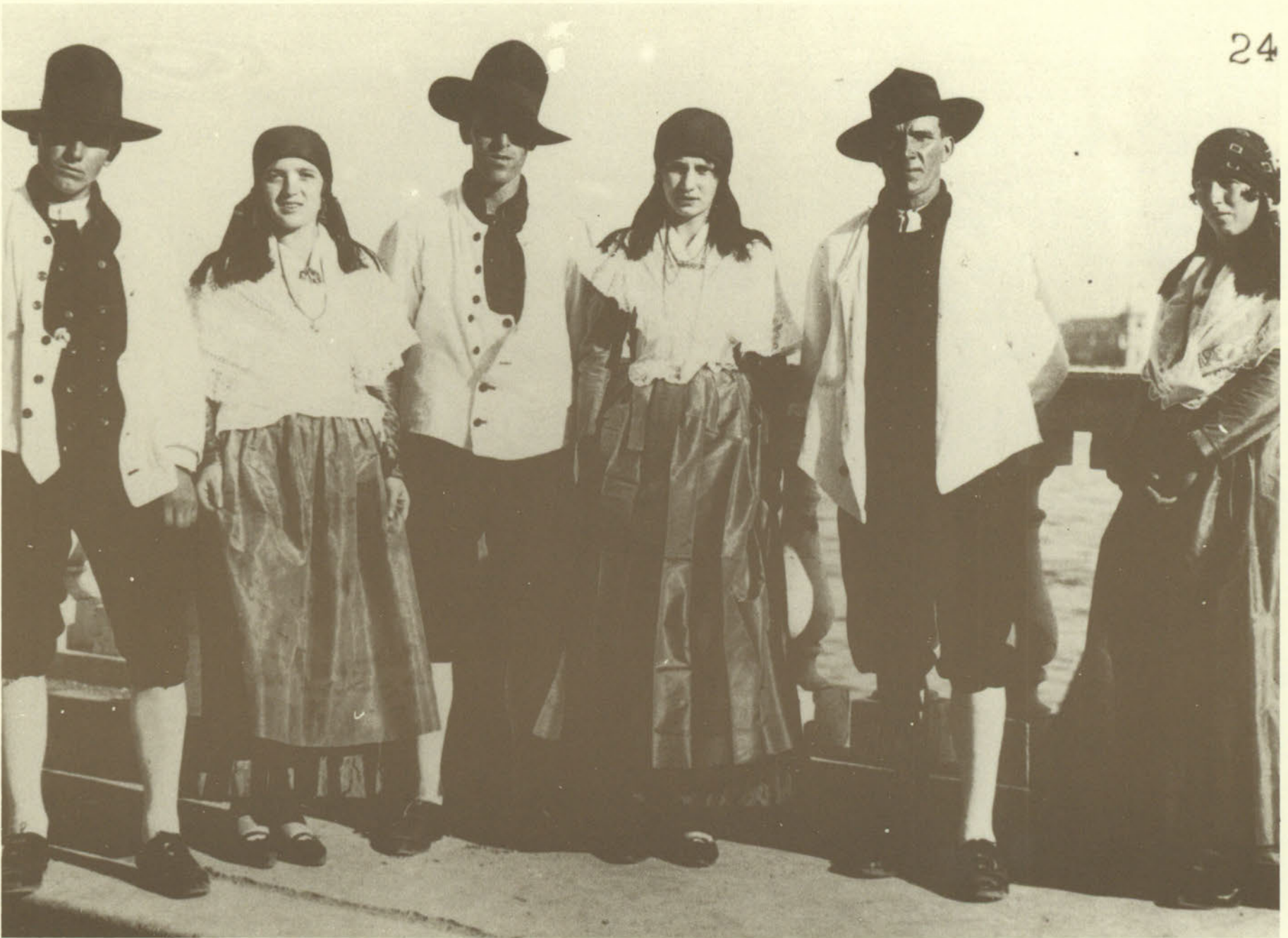
1928: COSTUMI GORIZIANI A VENEZIA