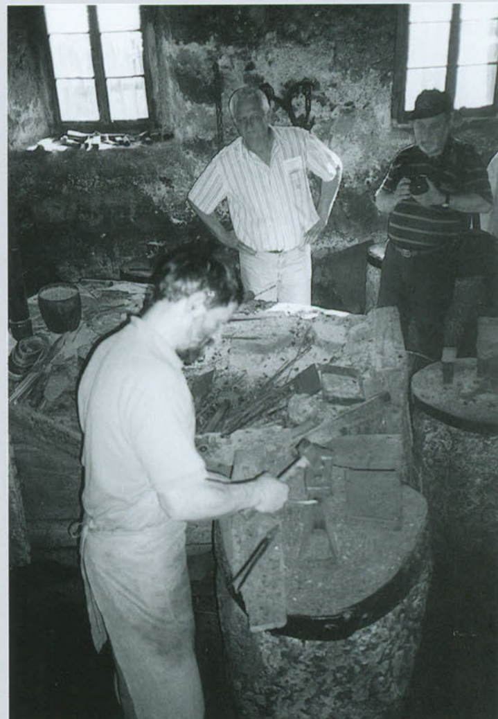
Kropa (Slovenia): così abbiamo visto "nascere" i chiodi