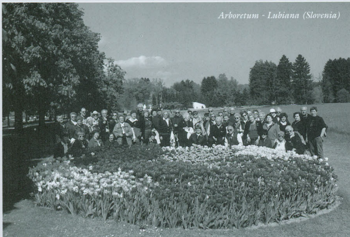
Arboretum - Ljubiana (Slovenia)