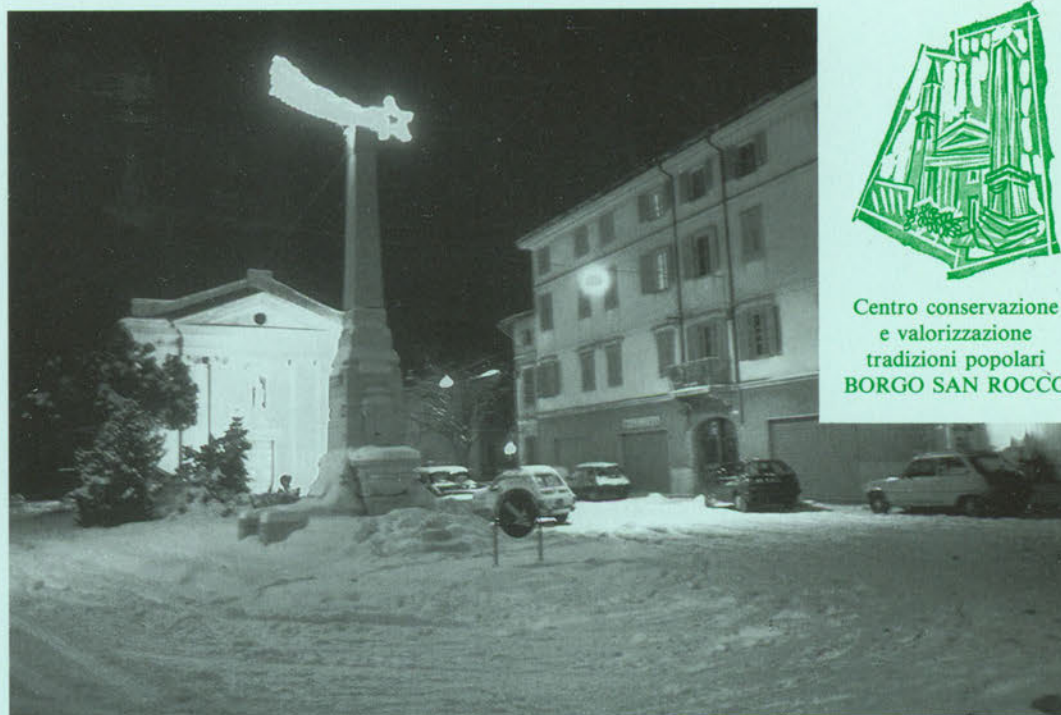
Bon Nadal e felis gnôf an a duc' i Sanrocârs