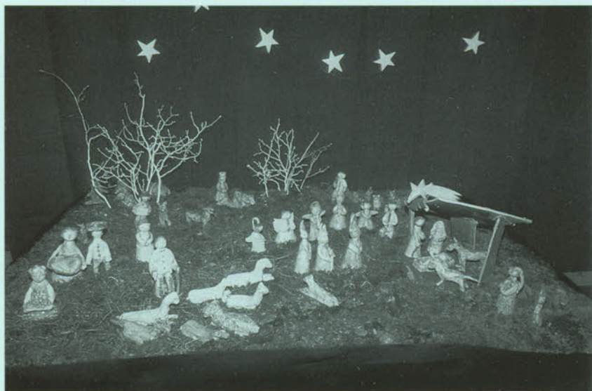
Concorso per il presepe