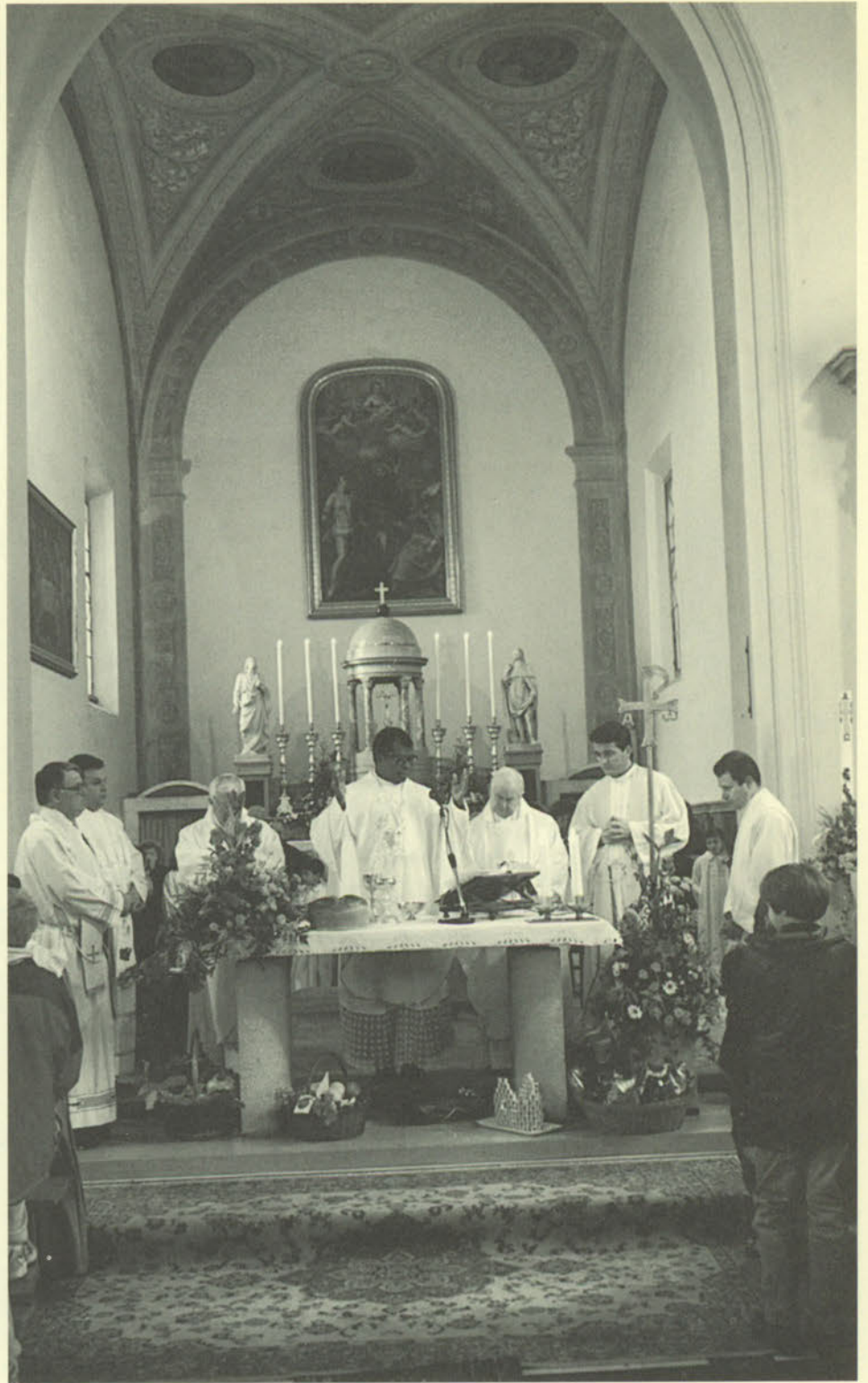
Solenne concelebrazione eucaristica