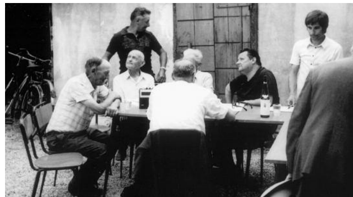
Gara dai scapnotadòrs, la prima giuria, agosto 1976