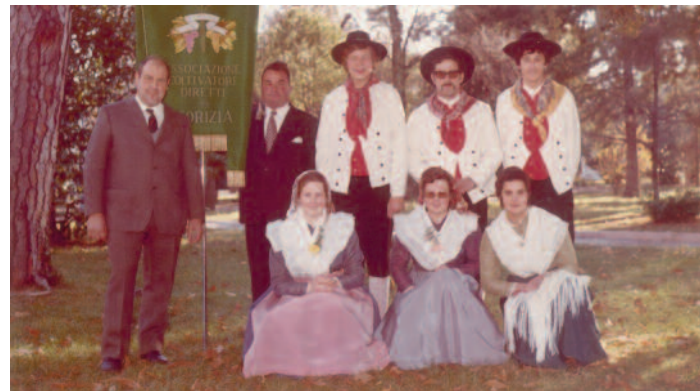
Festa Provinciale del Ringraziamento, novembre 1973