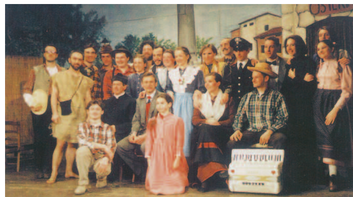
1997, "Frut cori pai cjamps" di Marino Zanetti