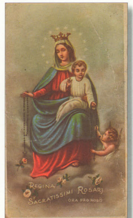
Madonna del SS. Rosario. Le origini del Rosario sono discusse. La tradizione domenicana ne dà il merito a san Domenico. Si sa per certo che un terziario domenicano, Bartolo Longo, portò a Pompei una tela con la Madonna del rosario tra san Domenico e santa Rosa. (7 ottobre)