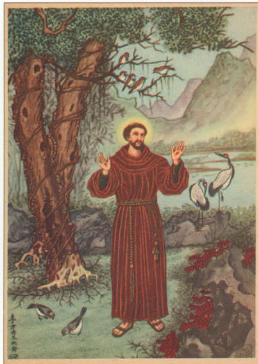
San Francesco d'Assisi rinunciò alle ricchezze paterne per offrirsi a Dio con grande amore per l'uomo e la natura. E' patrono d'Italia. (4 ottobre)