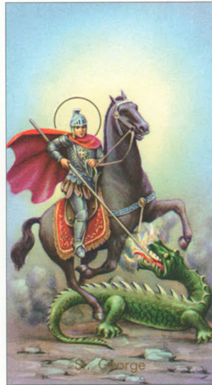
San Giorgio fu decapitato per la sua fede di cristiano, durante la persecuzione di Diocleziano. E' patrono dei cavalieri e dei boy-scouts. (23 aprile)