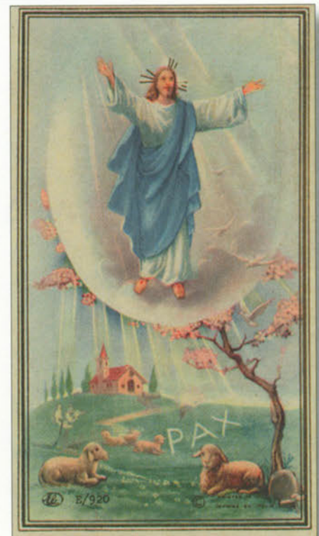
La Resurrezione di Gesù è il compimento del mistero pasquale. (Santa Pasqua)