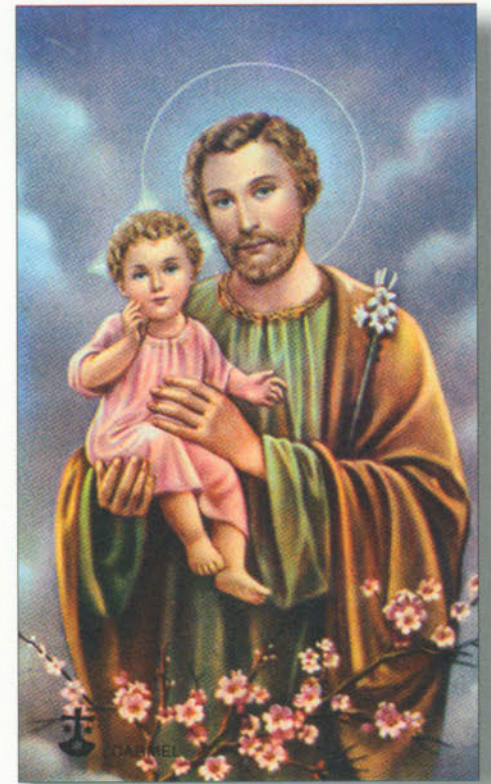
San Giuseppe di Nazareth era un modesto falegname.

Egli, con accanto la sposa Maria, fece da padre a Gesù e lo seguì amorevolmente nella crescita facendolo giocare ed imparare nella propria bottega. (19 marzo)