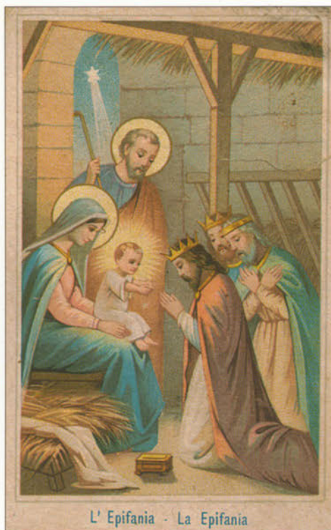
L' Epifania - La Epifania

I tre re Magi, guidati da una stella, giunsero dall'Oriente a Betlemme per recare omaggio al Bambino Gesù. (6 gennaio)