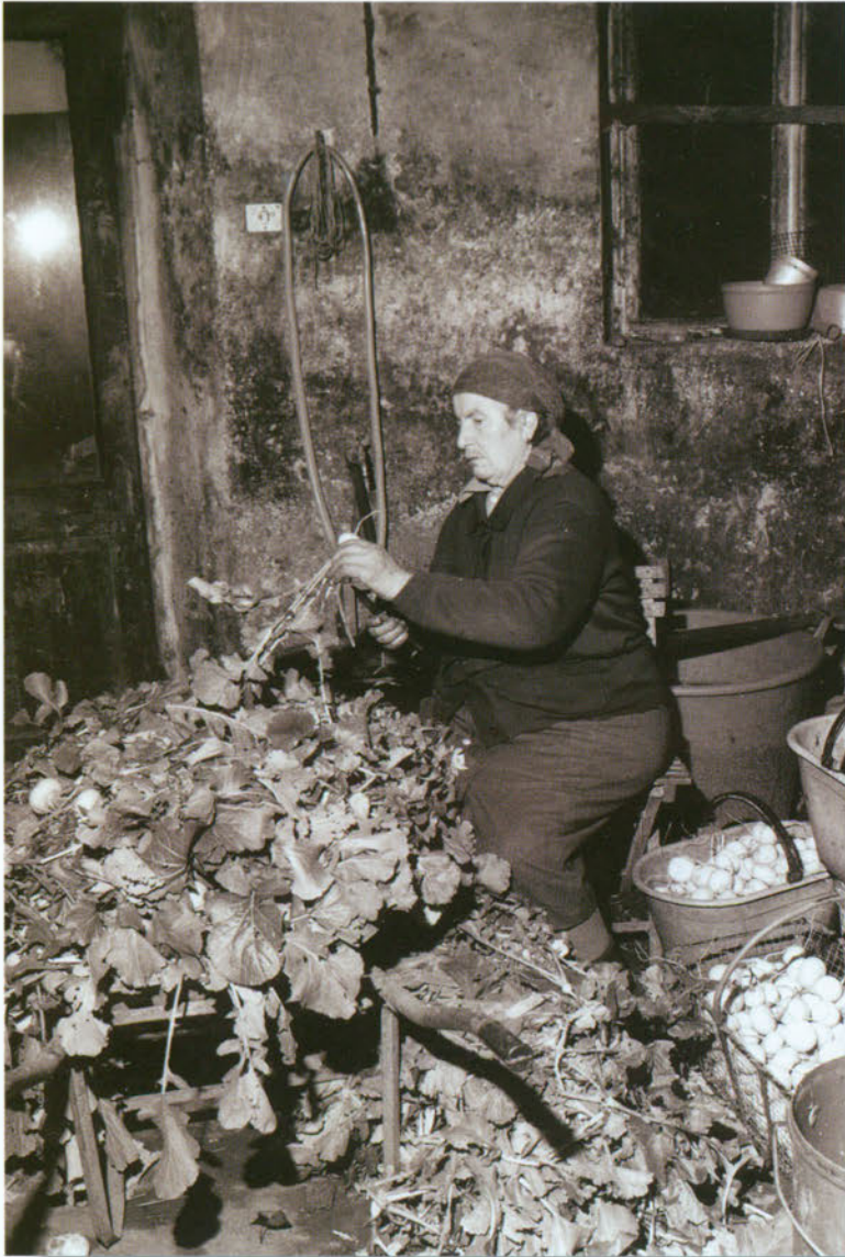
Siszent ufiei pai sanrocars.