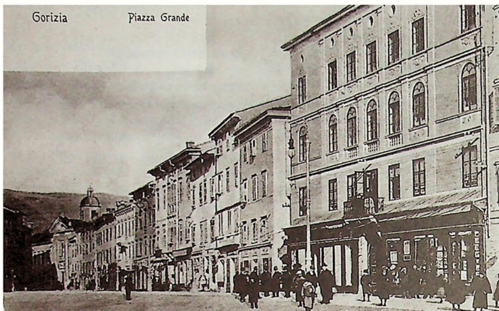
In primo piano a destra, la casa Paternolli