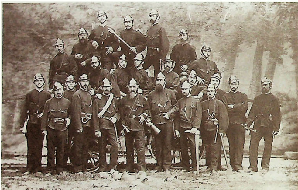
I pompieri di Gorizia nel 1899