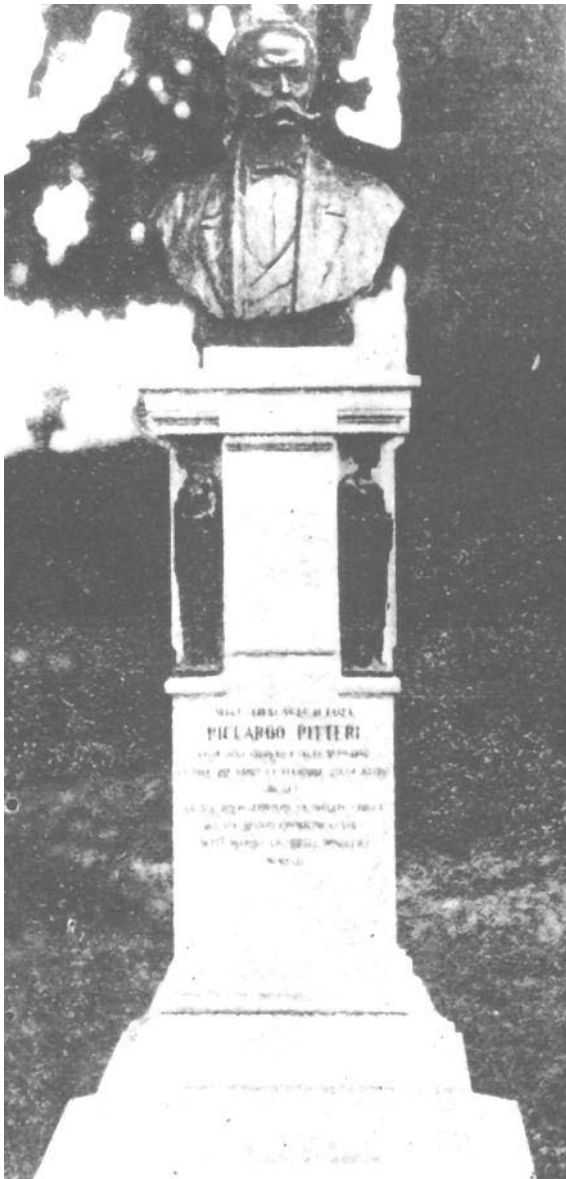
Il monumento a Riccardo Pitteri fu inaugurato il 24 ottobre 1926 (proprietà A. Bombig).

Intun lamp la gnova da disgrazia a veva fat la corsa pal païs. Chel zovin sul flôr da vita ch'al sbisiava cun disinvoltura bombis e granatis, al jera saltât par aiar e ridot e smorseât in mil bocons. A vevin vût se fâ par ingrumâ ca e là i tocs samenâts dulintor e picjâts parsin sui arbui par podê componilu inta cassa di muart. Pôr Zuta, al veva par fuarza di finîla, una di o chê altra, cussî malamentri.