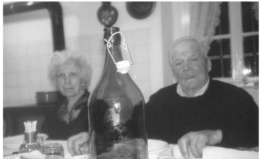
Il "feral" no manciava mai su la taula.

Un lusor distudat in tal cuarp ma no ta memoria che ja lassat.