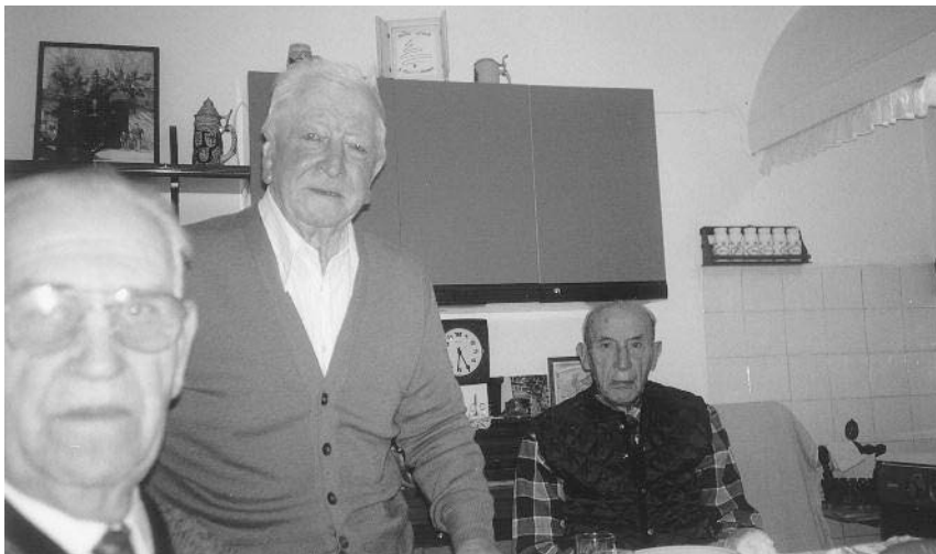
Una posa par ricuardasi ...

di mari -, a discori di zovin e vecio di luna, bon par butâ soto l'ardelut o plantâ la altana di brocui. E chês ciacaradis no finivin sença cualchi batuda sot vos dal "cavalier" (lu veva nominat Cossiga il 2.6.1987, e pocs ta parintat jarin vignus a savê: no amava meti in plaça il propri merit), che capivis daur l'eco da lis sganassadis da la Ana, che si platavin simpri daur di chel so "Signorut benedet!".