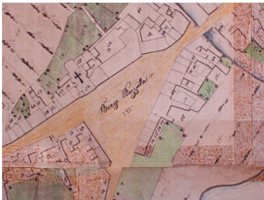
Piazza Tommaseo già "Piazzuta" Probabilmente antec. al XVII secolo