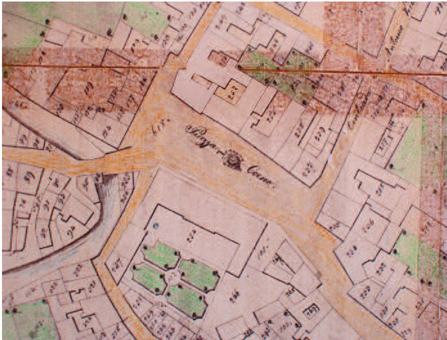
Piazza de Amicis già Piazza Corno antecedente al XVII sec.