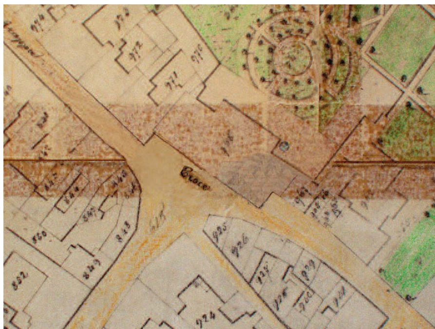
Piazza del Municipio già Santa Croce XVI secolo