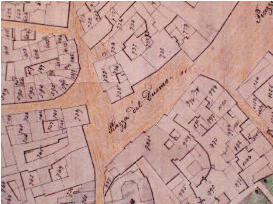
Piazza Cavour già Piazza dei Nobili antecedente al XV sec.