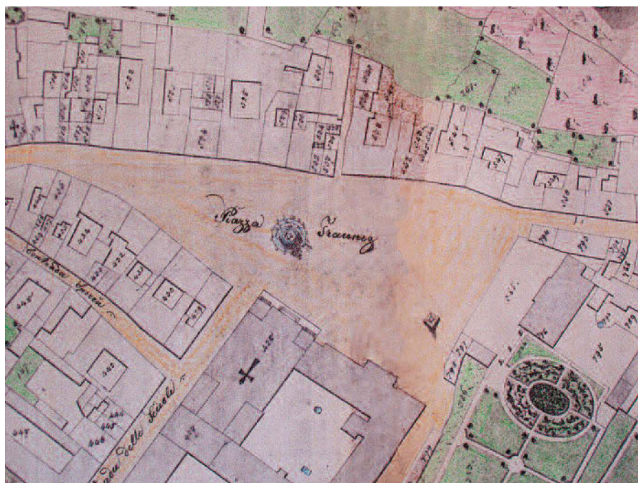
Piazza della Vittoria già Travnik antecedente al XV sec.