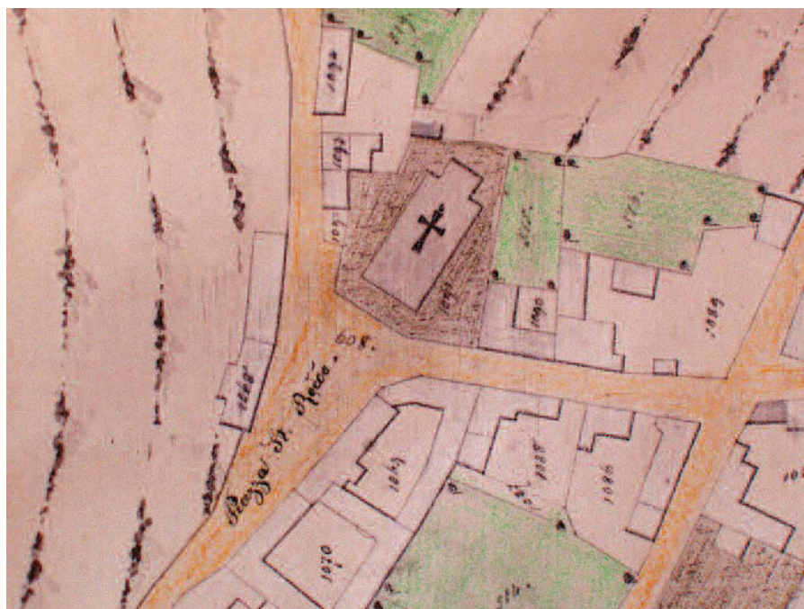
Piazza S. Rocco XVII secolo