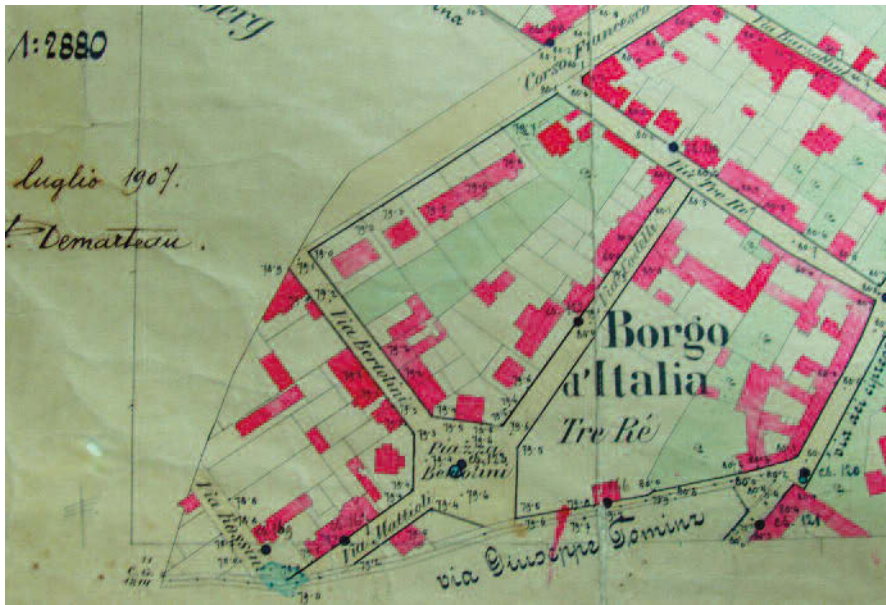
Piazza Divisione Julia già Piazza del Fieno. XIX sec.