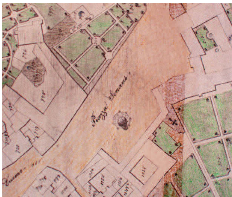
Piazza S. Antonio già Piazza Senaus antecedente al XV sec.