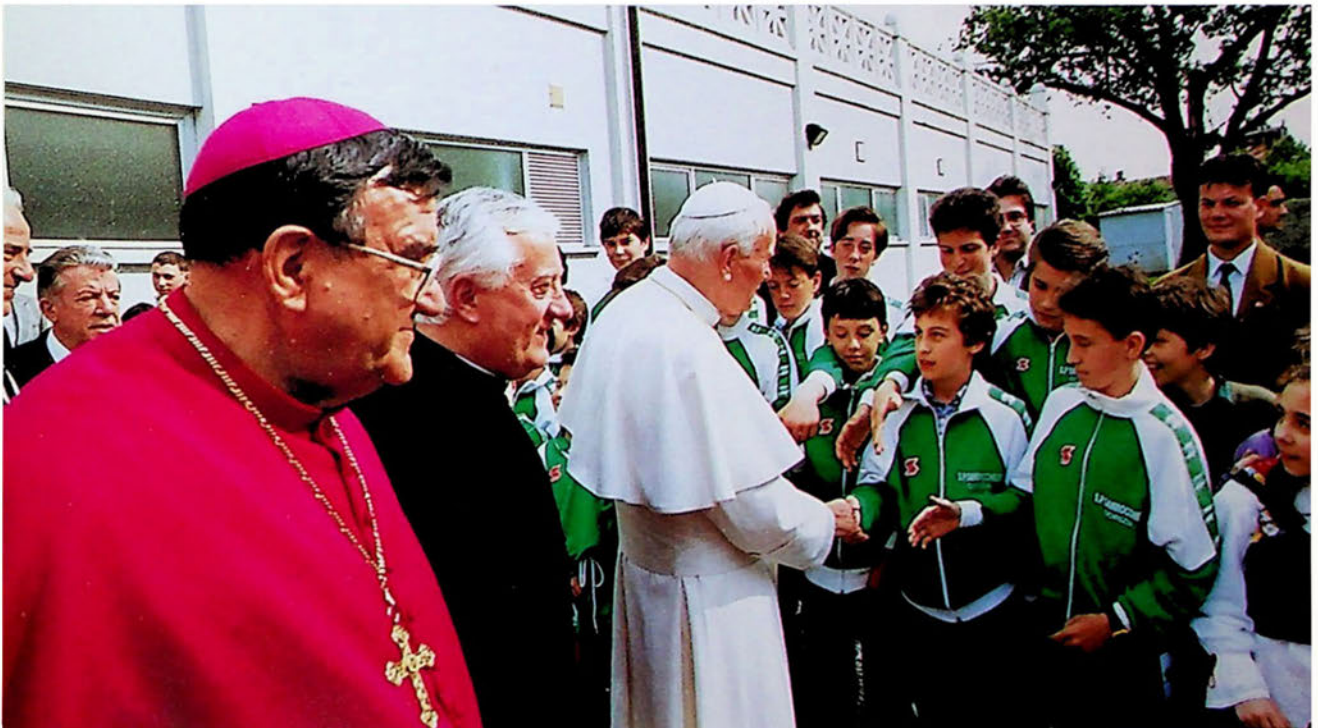
Giovanni Paolo II all'uscita dallo stadio Baiamonti si intrattiene con i giocatori e i dirigenti della S.P. Sanrocchese.

tant di podê emplâ parfin un libri cussì penz di tramandâlu cun braùra a chei ch'a vignaràn. Eco culi una da tantis situaziions vivuda in prima persona di cui ch'al scrîf, sperant che