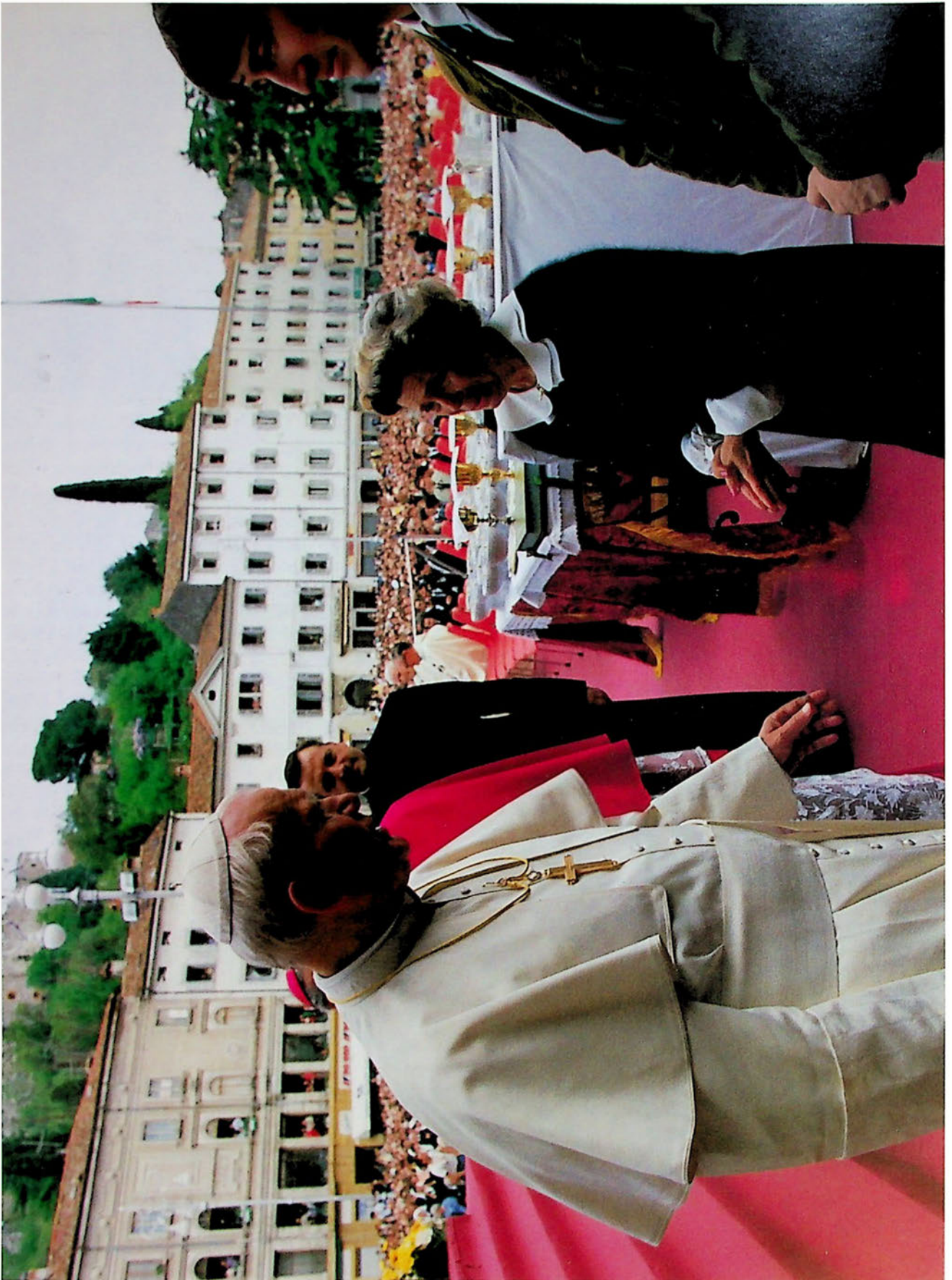
Giovanni Paolo II in Piazza Vittoria a Gorizia salutato sulla porta di S. Ignazio dai lettori.