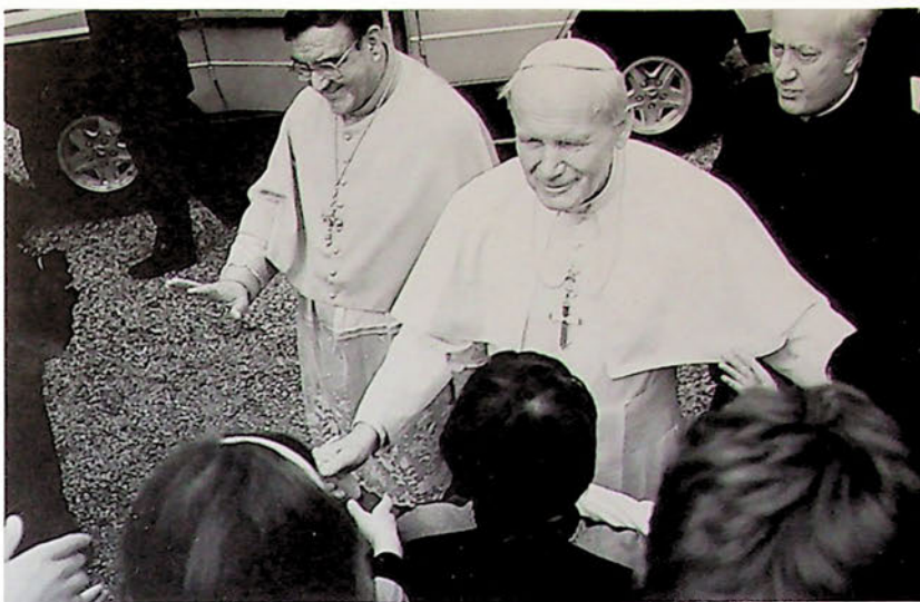
Anche i piccoli del gruppo «Lis Luzignutis» si stringono attorno al Papa.

In chel, a jê jera vignût-sù tal cjâf ch'a ti veva butât-jù ancja dôs riis in poisia indulâ ch'a si bramava bessola di jessi almancul una zisiluta par