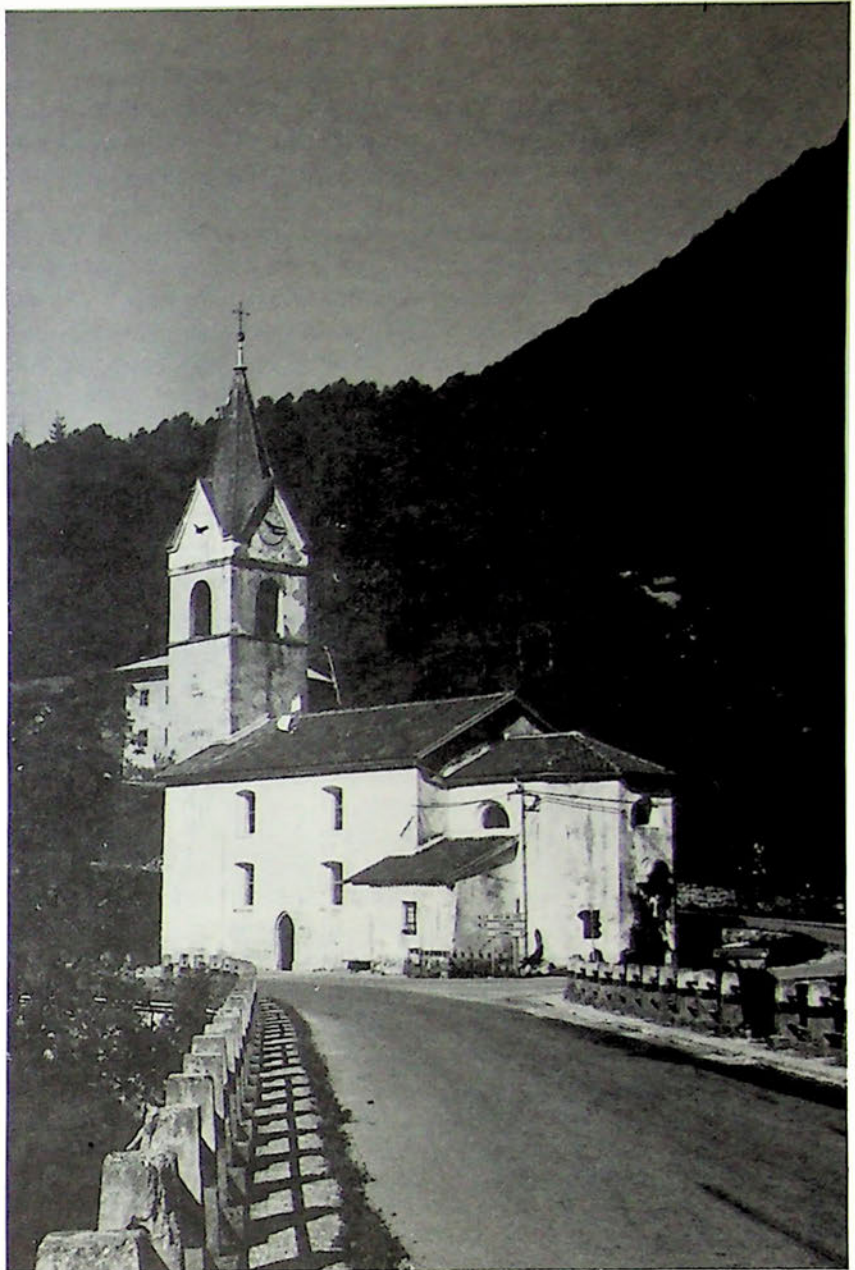
La glesia di San 'Zorz (dongia Idria).