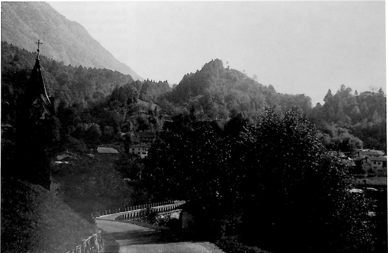
Panorama cul tôr di San 'Zorz e 'l puînt su la Bacia.

Un odôr garbit come il sòlfar 'na di al vigniva su da valada puartât cun t'una bavela di amont. Pôc dopo un trugnament font, grîs, di ciars pesans che ingramolavin i tornans da strada. Si rimpinavin rabiôs banda i boscs di Tarnova dulâ che ancia 'Zanel al spietava la granda prova che si nunziava. Un furmiâr tra ôns e machinis di uera. Si era sul cricâ dal di. Sigûr a' erin plui di vinc' mîl tra todescs, fascis'c' da Decima Mas, belagardis'c'. 'A era dongia la fiesta di Sant'Jusef. Al zîl si veva velât di tant sbarâ. Tun fun ruan fis'ciavin tajant 'l ajar di ogni banda granadis e balins. 'L era clâr che i Comanz germanics vevin dezidût di fâla finida cu la resistenza sul splan alt di Tarnova, chel splan inmens di arbui che di sot al someava pizzul ma che drenti 'l era