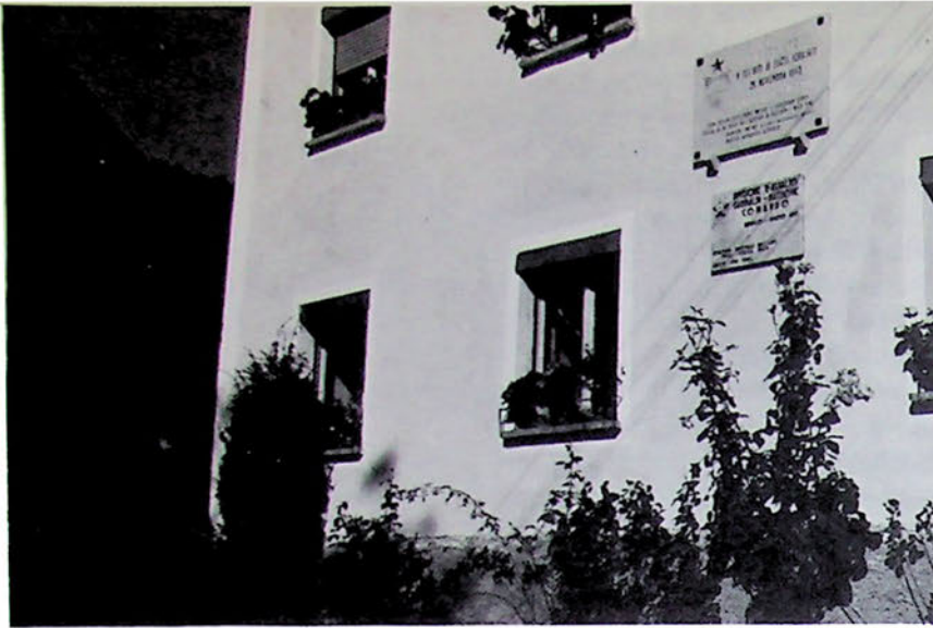
La piera su la ciasa dal Comant da «Garibaldi-Natisone» a Zakriž.

un continent dulà che no si vignìvigi fûr. Al plan todesc, cun tanti' fuar-zis, nol era altri che un grant zercli di strenzi un fregul in di fin a fâ un sac dulà brincaju duc' e distrigaju t'una musica di mitrais, un conziart di buna Pasca che colava qualchi 'zornada dopo, al prin di avrîl.