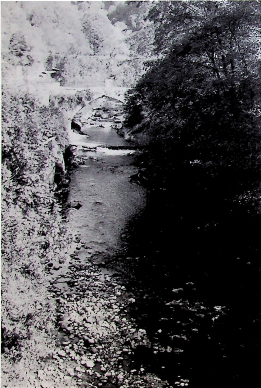
La Bacia (Bača).

Doventât mestri 'a era ora di dezizions par 'Zanel. Gi vignivin amenz simpri plui daspês li' peraulis di sò pari. 'L instât dal '44 al coreva ban-