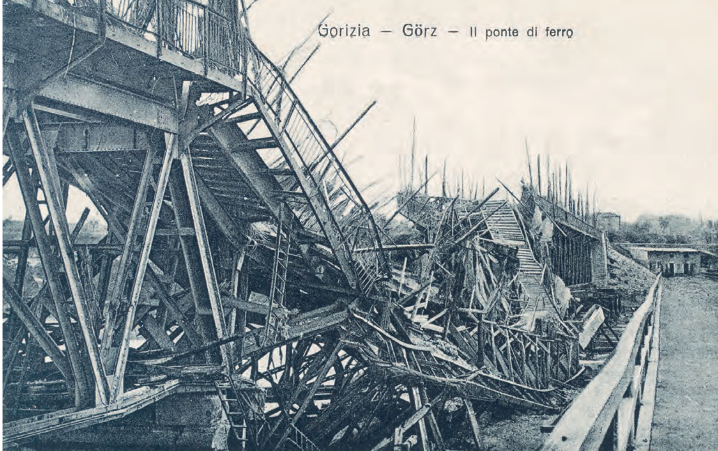
Il crollo del Ponte di ferro, anch'esso ceduto alla guerra.

sola, terribilmente sola... Ebbi un istante di debolezza, poi mi feci cuore, rinnovai a Dio il sacrificio, scesi presso il tabernacolo e divenni più tranquilla. – Gesù mio unico sostegno, mio tutto ed io la Tua straccia!